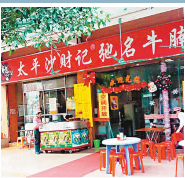
廣州太平沙財記北京南總店。