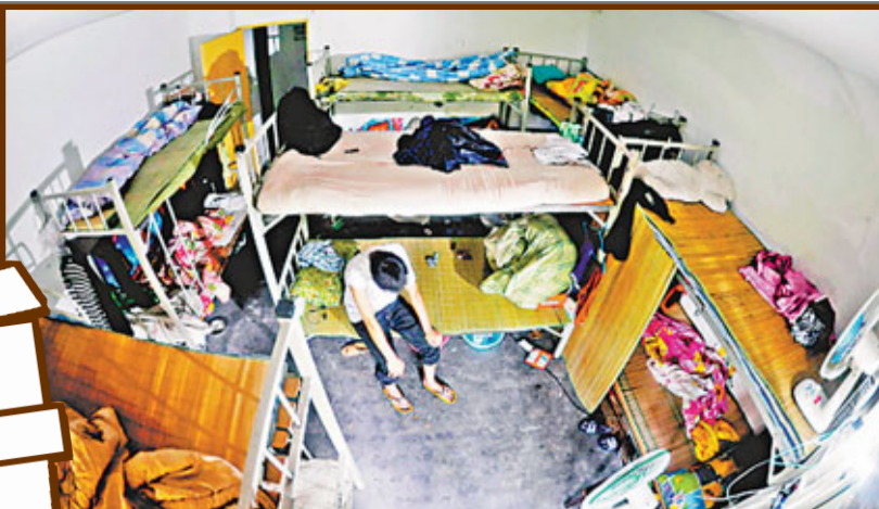
內地打工族年輕人因價廉而選擇租房,卻不知其中諸多安全隱患。

但是銀老師並沒有住進分配的經濟適用房。「2009年的時候,一個公司的副總找我,要租我的這間毛坯房,我就按照1個月1000元的價格給了他。」