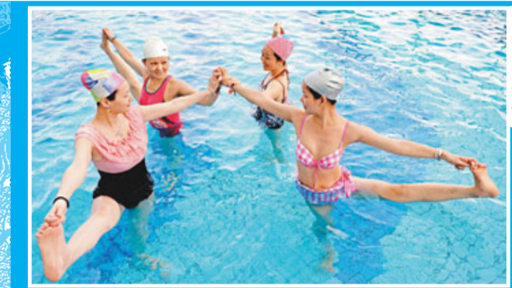
7月14日是農曆盛夏「三伏」節氣的初伏。當日下午,福建福州女青年在瑜伽教練的指導下練習水中瑜伽,清涼置身。

對此,有關政府建設官員指:「根據規定,經濟適用房是不允許出租的,群租更要被禁止,私自改變房屋結構的做法也不行。」