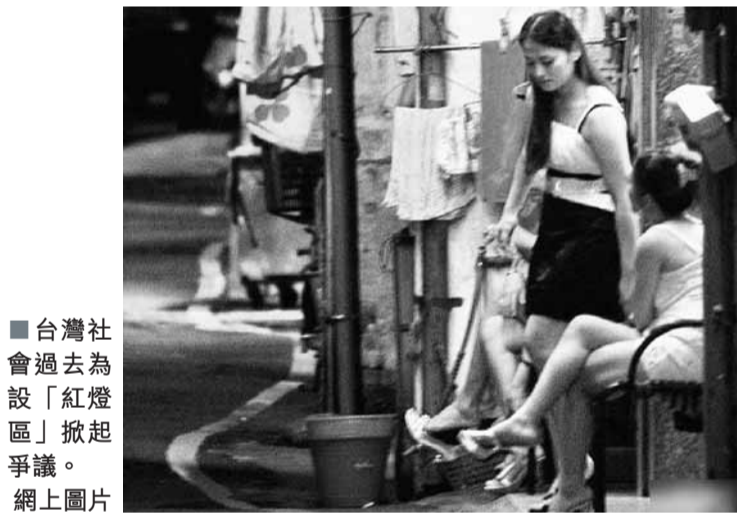
台灣社會過去為設「紅燈區」掀起爭議。網上圖片