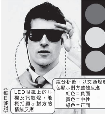
LED眼鏡上的耳機及訊號燈，能概括顯示對方的情緒反應