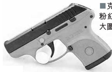
克萊因在州議會展示粉紅色半自動手槍(放大圖見左)。

美國亞利桑那州女參議員克萊因(見圖)上月接受報章訪問時，在展示其所攜手槍的激光瞄準器時，竟將該柄已上膛的手槍指向記者胸膛。事件曝光後引起軒然大波，支持擁有槍械權利人士炮轟她漠視槍械安全。克萊因則辯稱，當時「手指沒放到扳機上」，又稱她只是將手槍指向牆壁，是記者自行移到手槍前。