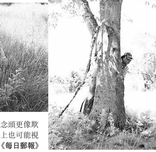
然而，即使莫西諾真的打算推出這「遊戲」，也未必能獲法例許可。法律專家表示，莫西諾的念頭更像欺詐罪行，縱使屬實，其狩獵活動在法律上也可能視為謀殺或協助自殺。 ■《每日郵報》

莫西諾的念頭或來自1994年的荷里活電影《生存遊戲》，電影主角獲聘在狩獵派對中當僕人，殊不知自己正是主人們的獵物。