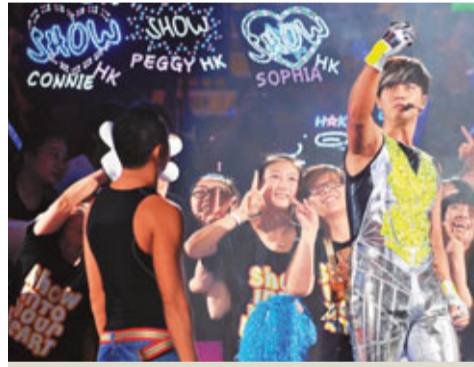
小豬又唱又跳，歌迷無限神往。

小豬在頭場時被鐳射燈射中重要部位，當晚他提起此事，笑說：「有觀眾把照片放上網。」跟着指着下體說：「大家很喜歡看嗎？」其後小豬欲拉母親上台唱歌，但遭羅媽媽拒絕。 當晚小豬的Fans不乏外籍人士，小豬便搞笑以英文道謝，安歌時，他請了一位小女孩