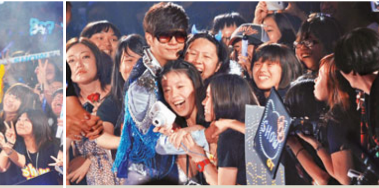
讓偶像羅志祥擁抱，女粉絲醉倒了。