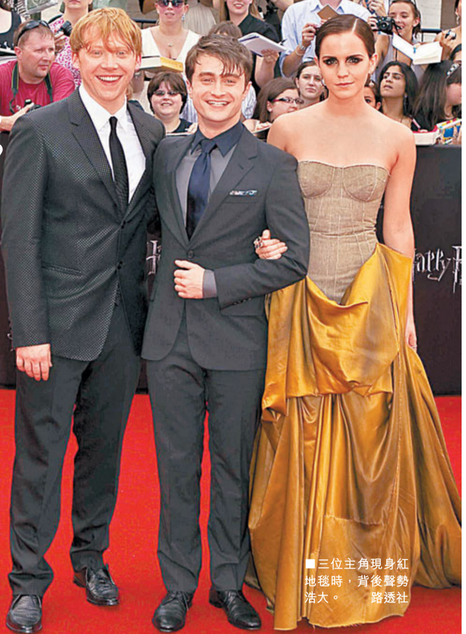
三位主角現身紅地毯時，背後聲勢浩大。