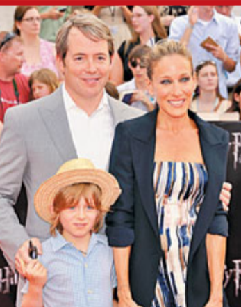
莎拉謝茜嘉柏加一家也來捧場。