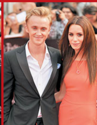
湯費頓再次攜女友現身首映。