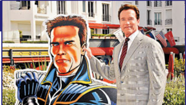
阿諾早前受醜聞困擾，無奈要延後復出頭炮《The Governator》。資料圖片

網站Deadline Hollywood引述匿名人士稱：「這是部古舊的西部片，特別為這位遇上道德難題的63歲老傢伙度身訂造……我們總需要一個標誌性的形象人物。」及後《Entertainment Weekly》也報道阿諾會參演此戲。據報道電影是講述美國國境警隊員追捕企圖越境逃到墨西哥的毒販的故事，同時也有指電影會由韓國導演金知雲執導。但