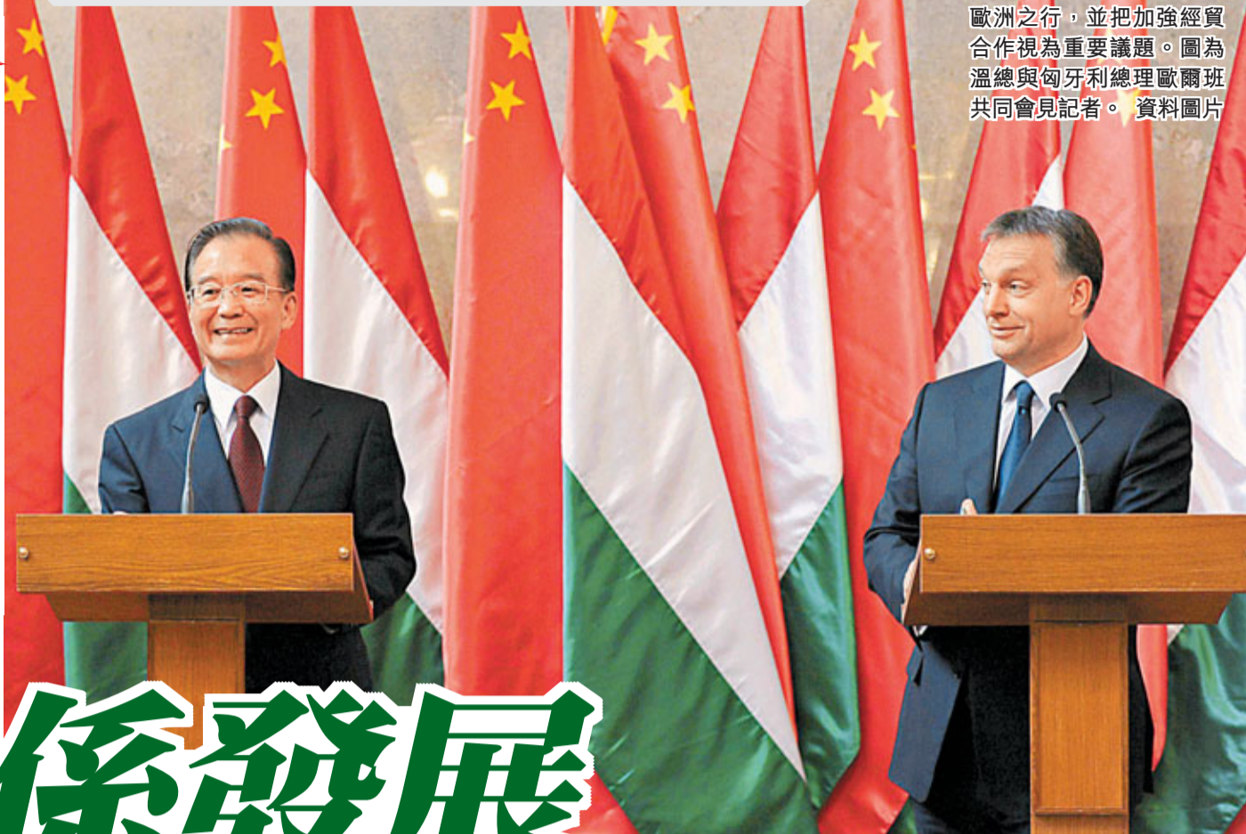
今年6月底，溫總展開歐洲之行，並把加強經貿合作視為重要議題。圖為溫總與匈牙利總理歐爾班共同會見記者。資料圖片