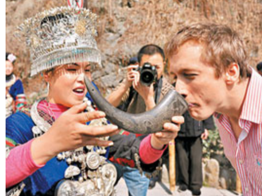
「中歐青年交流年」加深歐洲青年對中國的了解。資料圖片

及匈牙利等簽署超過200億美元的合作訂單，涉及節能環保、金融及物流等多個領域。此外，溫總設定幾個重要目標：至2015年，中德雙邊貿易額達2,800億美元，中英雙邊貿易額達1,000億美元，中匈雙邊貿易額達200億美元。