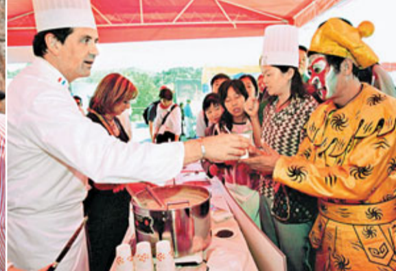
中國近年舉辦不少聯合活動，如「中法文化年」，加強與各國的民間交流。

2006年，歐盟當中的鞋業生產大國意大利、西班牙和葡萄牙等，要求對產自中國的進口皮鞋實施反傾銷稅。