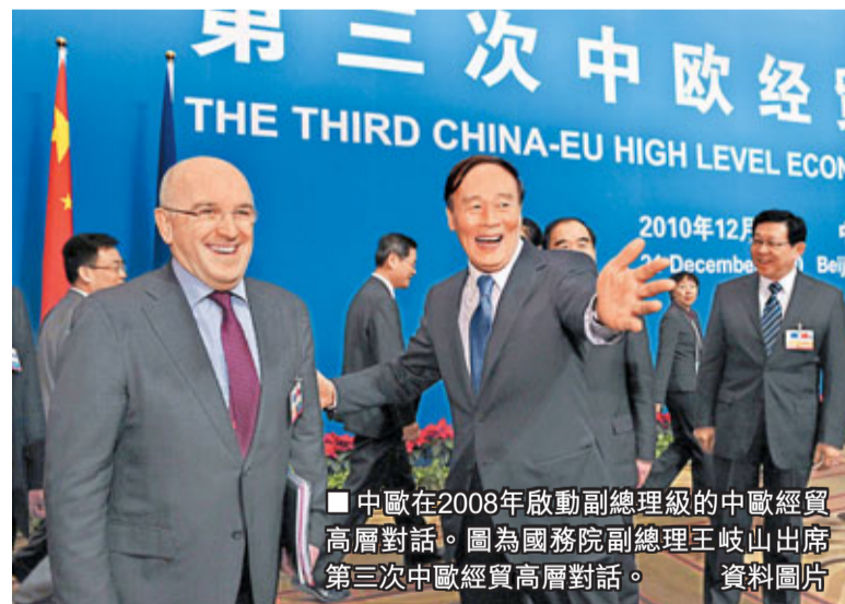
中歐在2008年啟動副總理級的中歐經貿高層對話。圖為國務院副總理王岐山出席第三次中歐經貿高層對話。資料圖片

1998年，中歐啟動每年一度的中歐領導人會晤機制。中歐亦建立多個外長級、大使級及專業司長級等多層次的定期對話機制。2005年，中歐建立副部長級的戰略對話機制。2008年，中歐啟動副總理級的中歐經貿高層對話。