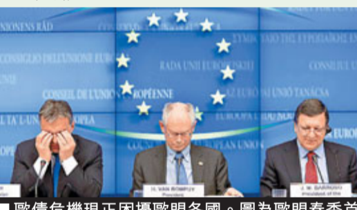
歐債危機現正困擾歐盟各國。圖為歐盟春季首腦會議。資料圖片

自上世紀90年代中期以來，中歐關係發展迅速，歐盟並沒有在政治議題如人權、西藏及台灣等問題為難中國。但隨着中國的國家實力不斷提升，尤其是歐盟對華的貿易逆差持續增長，歐盟開始在政治議題上與中國採取不合作態度。中歐關係出現暗流的主要原因有以下3點：