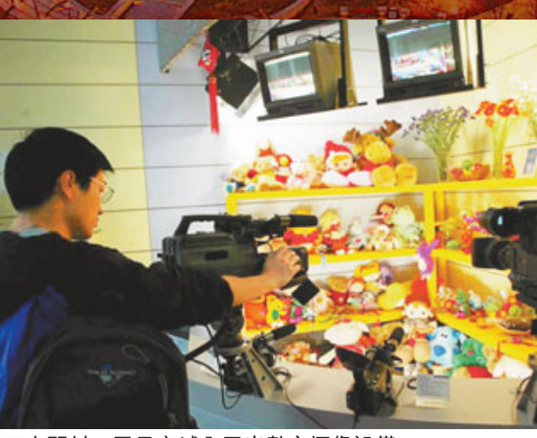
中關村一電子商場內展出數字攝像設備。