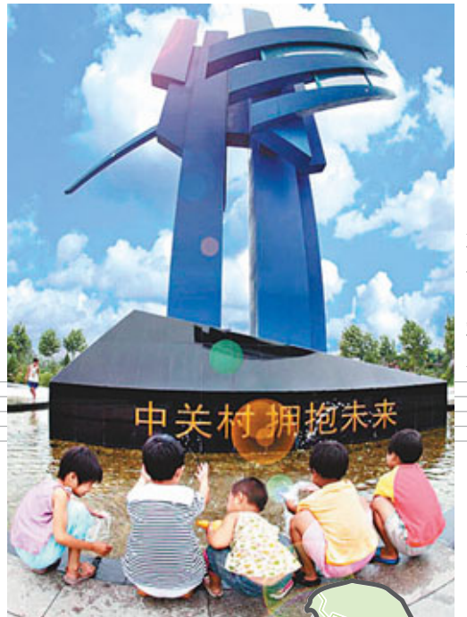
中關村肩負著面向世界、輻射全國、創新示範、引領未來的重任。