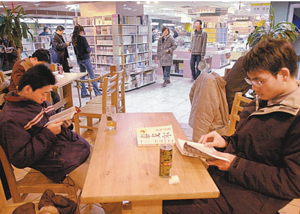
中關村的書店裡匯集了渴求知識的人們。

其四， 面對新形勢和新要求，中關村示範區應注重貫徹落實國務院關於中關村示範區建設的相關支持政策，用足、用好各項「先行先試」政策，完善和優化戰略性新興產業發展環境 。