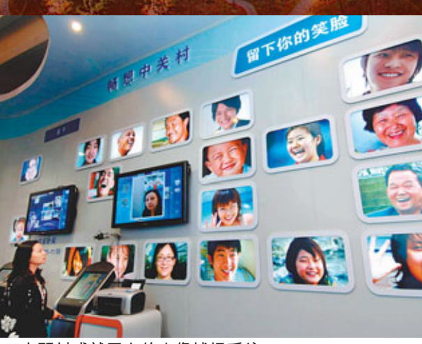
中關村成就展上的人像捕捉系統。