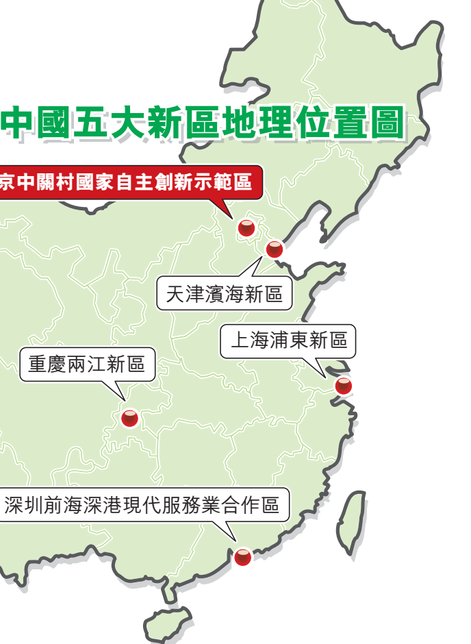
中國五大新區地理位置圖