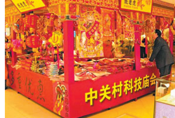
中關村舉辦「科技博覽會」活動。

作為中國經濟規模最大的高新技術產業基地，如今中關村的一些重要產業和技術產品在中國乃至世界具有舉足輕重的地位，計算機市場佔有率、手機產量穩居內地第一，軟件、集成電路設計產業收入分別佔全國的1/3和1/6。2010年，中關村示範區企業實現總收入1.59萬億元，較2009年增長22.9%，約佔全國高新的1/7；收入過億元的企業達到1,414家，比2009年增加161家。境內外上市公司總數達到189家。2010年有39家公司在境內外上市，創歷史新高，2011年已有14