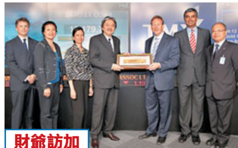
財爺訪加 財政司司長曾俊華展開為期5日的訪加之旅，首站為參觀多倫多證券交易所，與交易所的高層就各金融財經問題交換意見，並期望香港與多倫多的證券交易所加強合作。