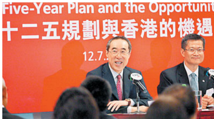
唐英年出席會計界座談會暢談「十二五」機遇，預期香港今後在擔當引領內地企業「走出去」的角色會更成功。

在「十二五」的大前提下，他認為，香港今後在引領內地企業「走出去」的角色會更成功，關鍵在於外國企業熟悉及相信香港的制度，而香港人亦掌握着與內地同聲同氣、文化相近的優勢。唐英年又打趣說，不少香港人的普通話水平比較「普通」，但跟說英文、法文的外國人已來得容易溝通，加上文化相近，內地人一句「有問題」，香港人至少可以揣摩箇中底蘊，探究出這是「有可能、不可能、還是可以坐低傾傾就能解決的問題」。俗語有云「入鄉隨俗」，他亦指，香港人要與內地融合發展就要適應「水土」，但同時卻斷不能放棄既有的特質及核心價值，反而要感染內地人民建立正面的素質。