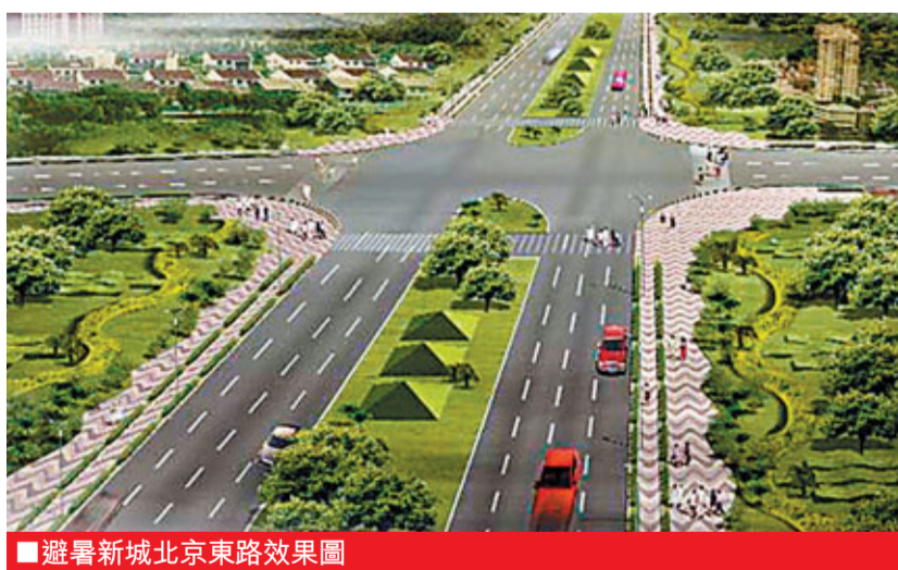
■避暑新城北京東路效果圖