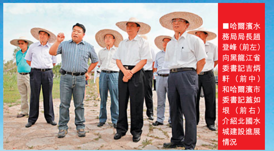
■哈爾濱水務局局長趙登峰(前左)向黑龍江省委書記吉炳軒(前中)和哈爾濱市委書記蓋如垠(前右)介紹北國水城建設進展情況