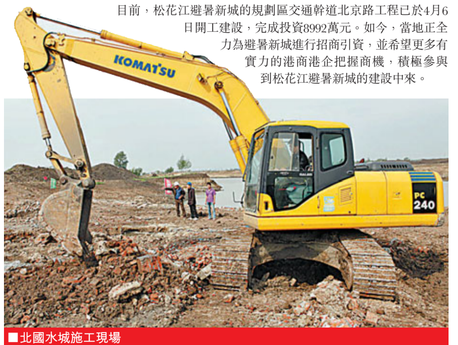
■北國水城施工現場

目前，松花江避暑新城的規劃區交通幹道北京路工程已於4月6日開工建設，完成投資8992萬元。如今，當地正全力為避暑新城進行招商引資，並希望更多有實力的港商港企把握商機，積極參與到松花江避暑新城的建設中來。