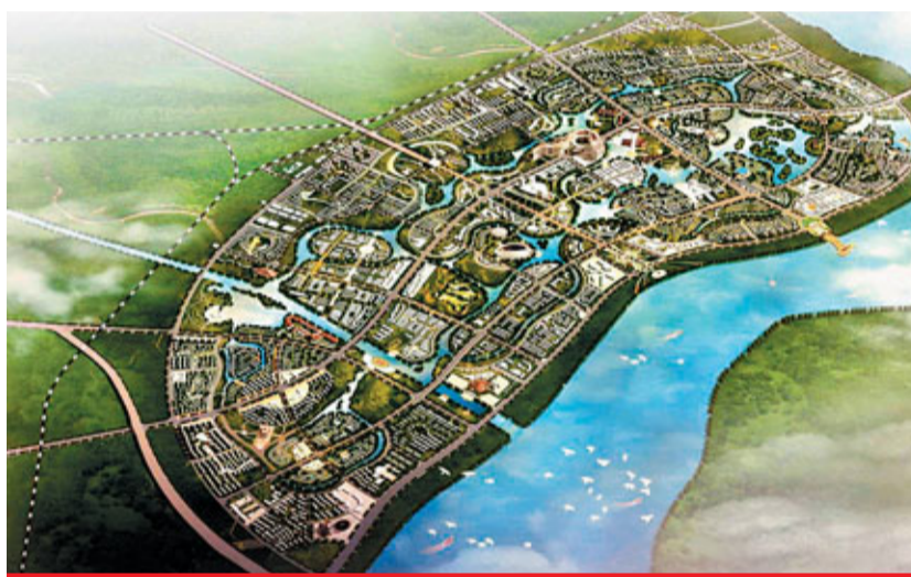
■松花江避暑新城總體效果圖