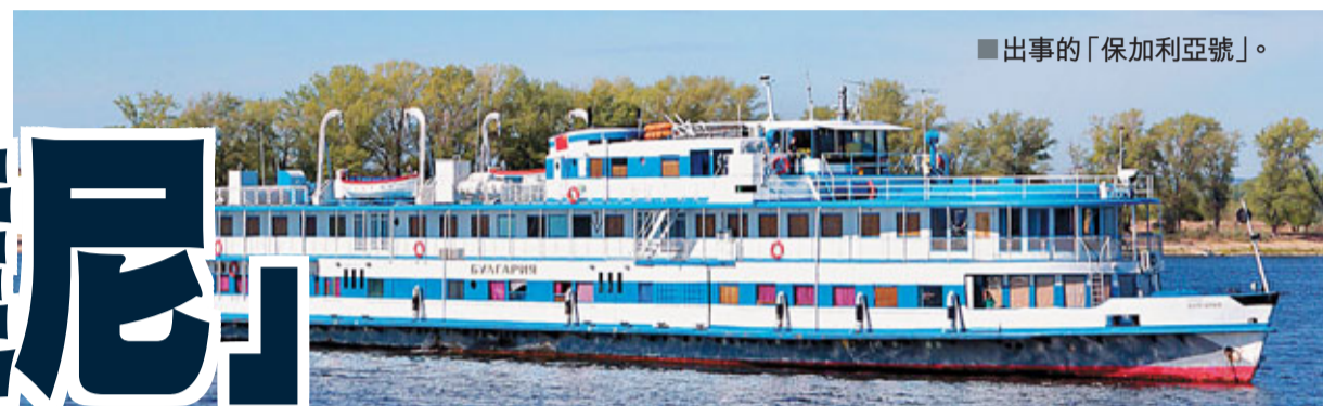
出事的「保加利亞號」。