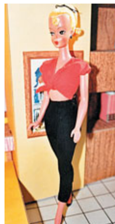
原來美國的芭比娃娃設計靈感來自納粹德國的吹氣娃娃。

二戰期間德軍感染梅毒的人數極高，根據紀錄，納粹魔頭希特勒遂於1940年「拍板」，為軍人添置50個吹氣娃娃，以免他們禁不住性慾，召妓「胡天胡帝」，感染性病影響戰事。