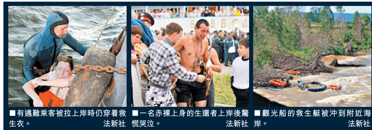
有遇難乘客被拉上岸時仍穿着救生衣。一名赤身上身的生還者上岸後驚慌哭泣。觀光船的救生艇被沖到附近海岸。

俄羅斯伏爾加河發生該國30年來最嚴重海難。有56年船齡的觀光船「保加利亞號」前日翻沉，208名乘客及船員中，約128人罹難，或包括最多60名小童，79人獲救，其他人失蹤。事發時忽然雷電交加，颶起狂風暴雨，船隻在3分鐘內迅速沉沒，很多人根本來不及逃生。國際文傳電社引述搜救人員稱，很多屍首仍被困在沉船殘骸內，30名遇難小童事發時據報正在上層甲板遊戲場玩耍。