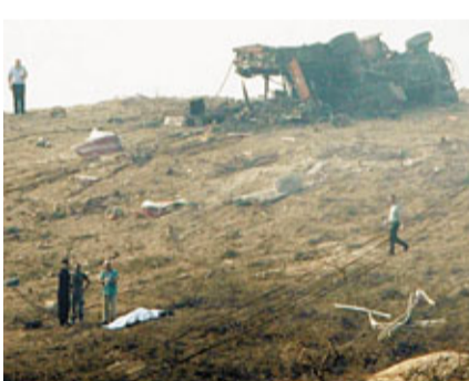
消防車被炸毀，遇難者屍體被氣流彈開。

塞浦路斯國民警衛隊一個海軍基地昨晨發生爆炸，造成至少12人死62傷，死者包括消防員和軍人。全國最大發電廠受波及損毀，引致廣泛地區停電，發言人形容為「大災難」。肇事原因可能是基地露天貯存的兩廂彈藥，難耐攝氏40度高溫爆炸，國防部長和軍方主管事後請辭，獲總統接納。