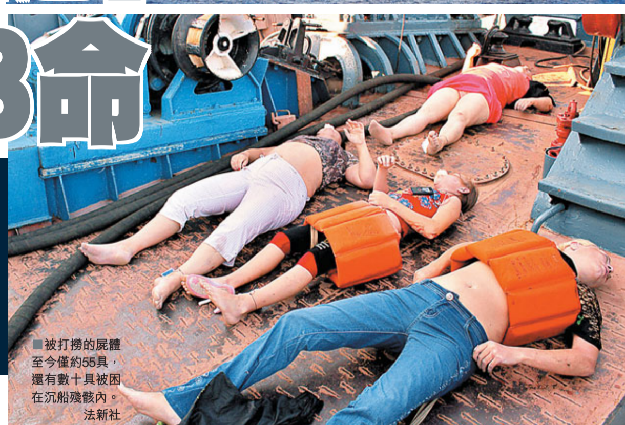
被打撈的屍體至今僅約55具，還有數十具被困在沉船殘骸內。