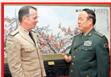
■郭伯雄會見馬倫，雙方就共同關心的問題交換了意見。

馬倫感謝郭伯雄副主席的會見。他說，美方對此次中國之行非常重視，與中方就如何落實已達成的共識和消除存在的分歧，都進行了坦率真誠的對話。