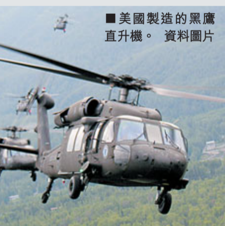
■美國製造的黑鷹直升機。資料圖片

中國國防大學朱成虎少將以及軍事科學院羅援少將表示，美國售台武器事件的後果是，毒化了兩岸和緩的氛圍，破壞了兩岸互信，對兩岸和平統一造成了新的障礙。中國海軍少將楊毅認為，美國對台軍售計劃是非常不友好的惡劣行為，是侵犯中國核心利益、對中國進行挑釁系列組合拳的重要組成部分，意在通過對台軍售對中國大陸施壓，服務於美國遏制中國的大戰略，中國絕不允許美國在台灣這個中國核心利益上進行挑釁。此舉必將引起中方的強烈反制。亦有專家對台灣媒體於馬倫訪華時報道此消息表示疑惑。中國軍事科學院世界軍事研究部研究員姚玉竹接受記者採訪時表示，美國在近期時間內，把南海問題演變成「自由航行權」的問題，美國認為他在南海有利益，這個利益就是自由航行權的問題。實際上自由航行權是所有使用公海海道進行航行國家的一部分利益，不僅是美國的，也不僅是中國的和東盟國家的。這個自由航行權是需要所有國家來共同維護。中美之間在南海沒有領土主權的爭議，所以這些問題，本身不是中國和美國的問題，是美國把自由航行權和主權問題混為一談，在高調的介入南海問題。