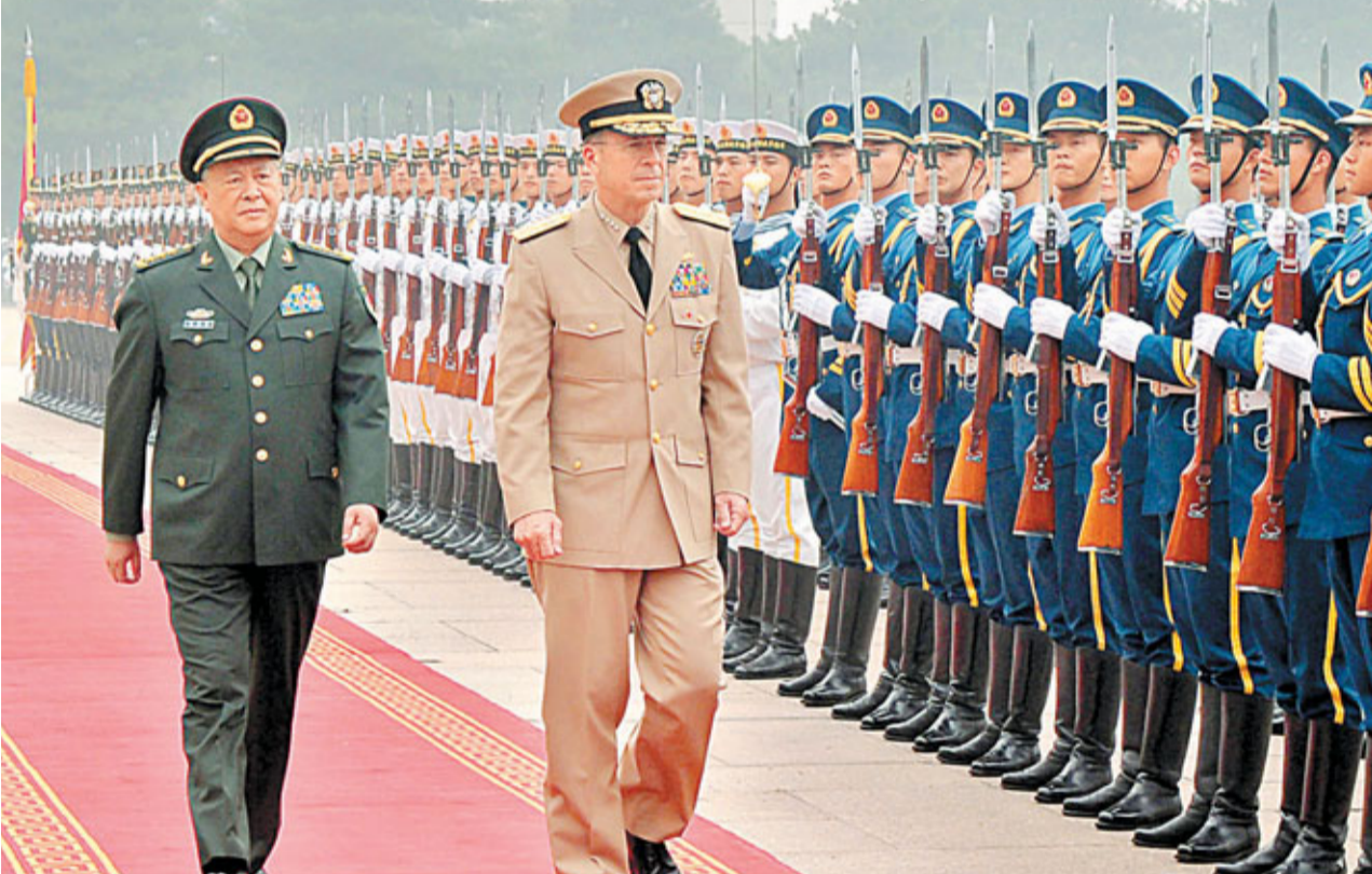
■中國人民解放軍總參謀長陳炳德上將為美軍參聯會主席海軍上將馬倫舉行歡迎儀式，並陪同檢閱中國人民解放軍三軍儀仗隊。

另據中央社報道，菲律賓外交部長11日在記者會上說，菲律賓總統阿基諾三氏預定於9月初訪華。