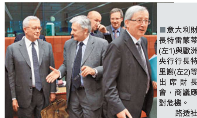
意大利財長特雷蒙蒂(左1)與歐洲央行行長特里謝(左2)等出席財長會，商議應對危機。