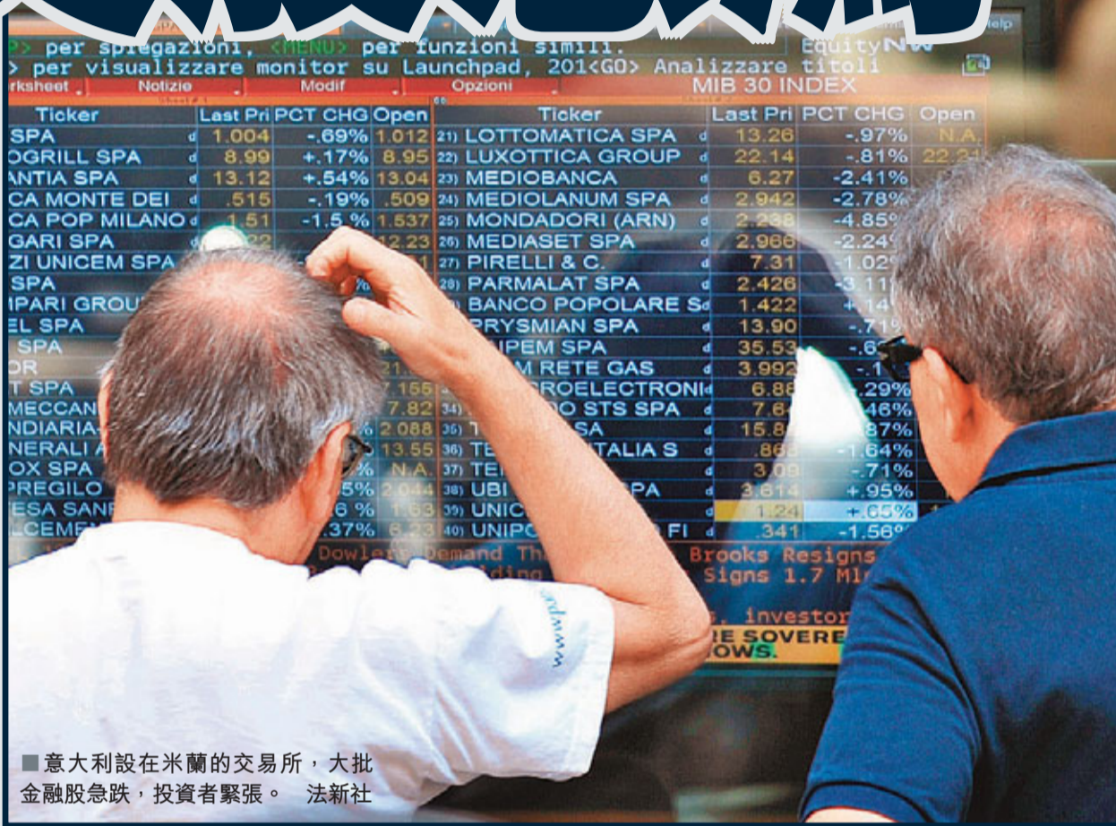
意大利設在米蘭的交易所，大批金融股急跌，投資者緊張。

歐元區財長昨日舉行會議，主要討論希臘債務危機的應對措施，同時希望消除投資者對債務危機由希臘、愛爾蘭及葡萄牙等小國，蔓延至意大利及西班牙等較大經濟體的憂慮。「歐元之父」蒙代爾警告，意大利政府債務高達1萬億歐元（約10.9萬億港元），但多位領袖否認該國在今次會議議程內。歐元區債務危機有擴散跡象，法國股市昨日尾市下跌3%，是超過12個月來最大跌幅。意大利股市昨日一度急跌4.4%。美股昨日裂口低開逾百點，道瓊斯工業平均指數早段報12,517點，跌139點；標準普爾500指數報1,324點，跌19點；納斯達克綜合指數報2,823點，跌36點。