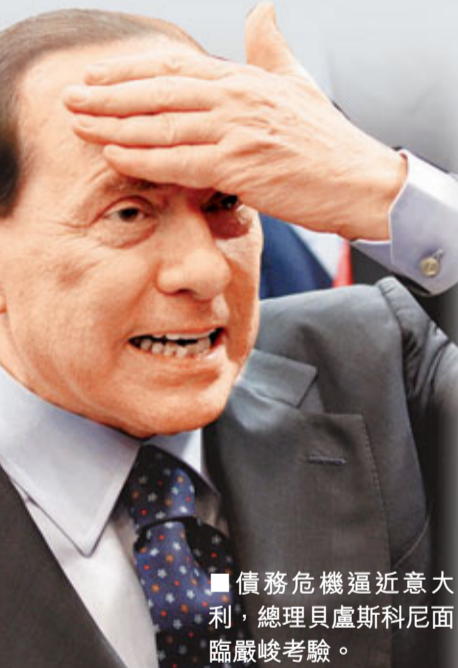
債務危機逼近意大利，總理貝盧斯科尼面臨嚴峻考驗。