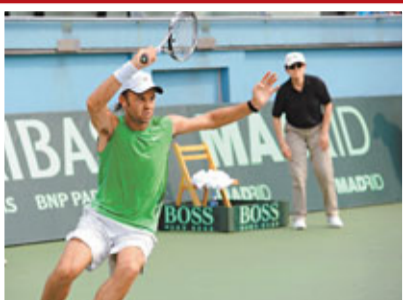
■古尼為港隊勝出最後一場單打。

在男子4x100米接力項目中以39秒26的佳績勇奪第二名，是香港田徑隊首次於亞洲田徑錦標賽奪得獎牌，港接力隊成員由鄧亦峻、黎振浩、吳家鋒和徐志豪組成。