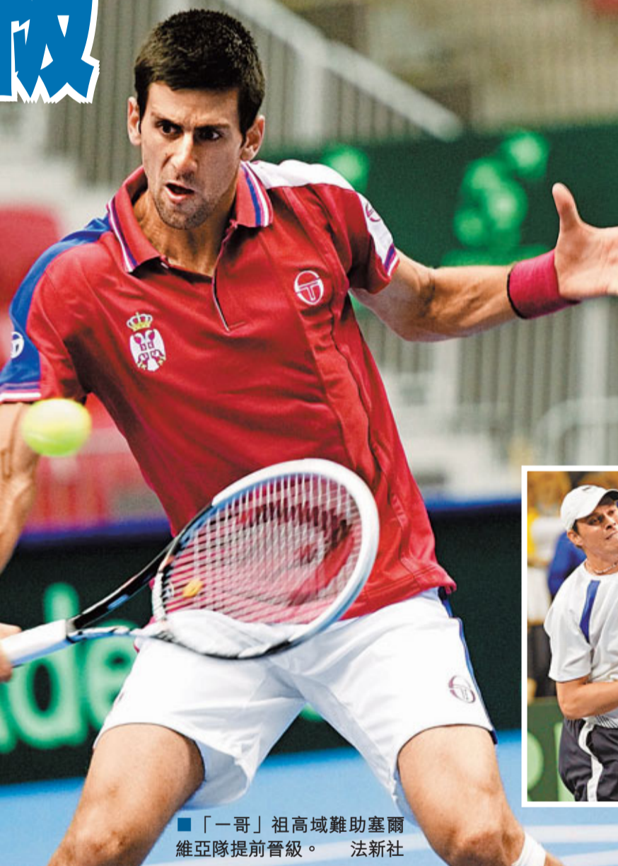
■「一哥」祖高域難助塞爾維亞隊提前晉級。

香港文匯報訊(記者 郭正謙) 戴維斯盃港隊完美收官！早前已篤定護級成功的港隊昨日憑藉古尼於單打再取一場，以總場數4：1擊敗敘利亞，為今年戴維斯盃旅程寫下句號。