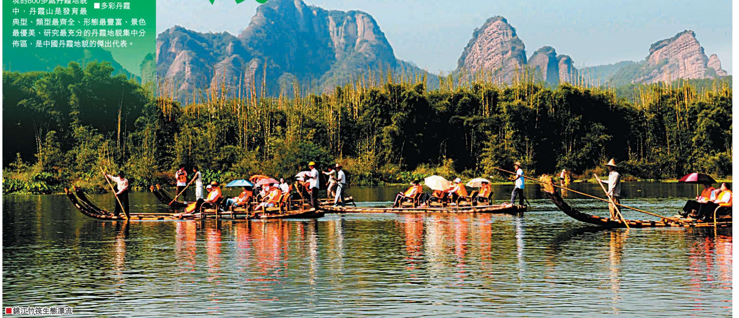
■錦江竹筏生態漂流

第六，加大宣傳促銷力度，提升世界自然遺產品牌價值。舉辦世界遺產旅遊節等大型節慶活動和學術交流活動，全力開發珠三角、長三角、環渤海、華中六省、港澳台、東亞東南亞六大客源市場，全力打造國內一流、世界知名的旅遊品牌，爭取3年內真正跨入全國性熱點景區行列。