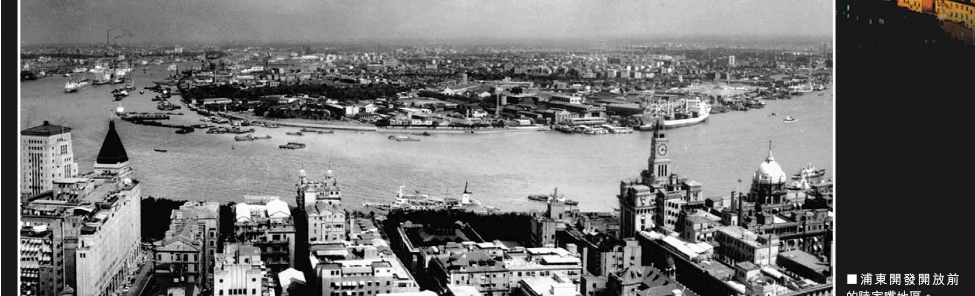
浦東陸家嘴地區夜景如畫。