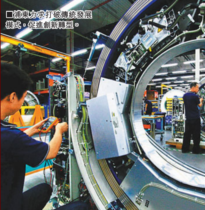
浦東力爭打破傳統發展模式，促進創新轉型。

隨着天津濱海、重慶兩江、深圳前海等經濟新區建設的加速，外界漸漸流傳起「八十年代看深圳，九十年代看浦東，新世紀看濱海」的說法，「老牌經濟區」浦東的發展後勁受到「新生代」的巨大挑戰。為此，浦東將以「創新驅動、轉型發展」這一增長模式來擺脫政策依賴，進行「二次創業」。