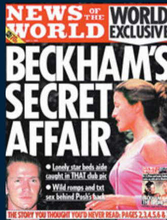
2004年4月4日 碧咸背妻偷腥