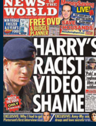
2009年1月11日 哈里王子種族歧視亞裔英軍