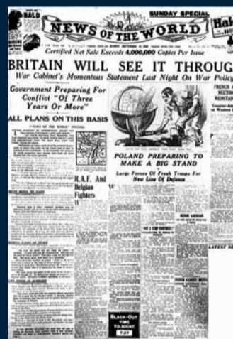
1939年9月10日 英國備戰納粹德國