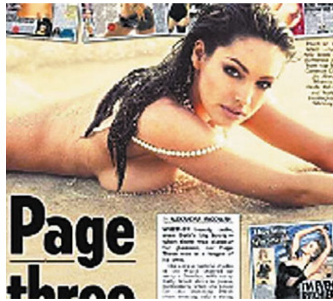
「告別號」列舉經典女星性感照，包括名模凱莉布魯克。網上圖片