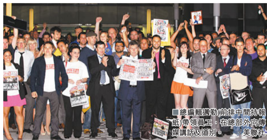
總編輯邁勒(前排中間持報紙)帶領員工，在總部外向傳媒講話及道別。