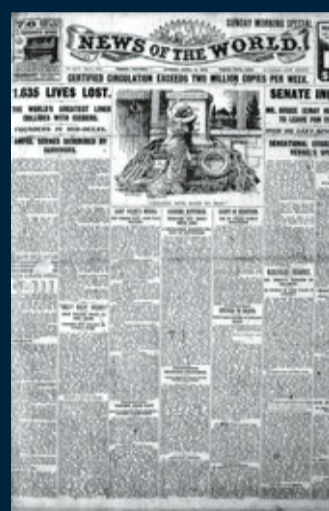
1912年4月21日 採訪鐵達尼號生還者