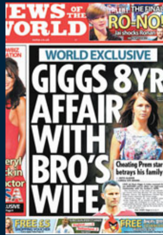
2011年6月5日 傑斯背妻偷食弟婦