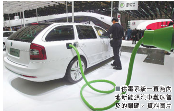
供電系統一直為內地新能源汽车難以普及的關鍵。資料圖片