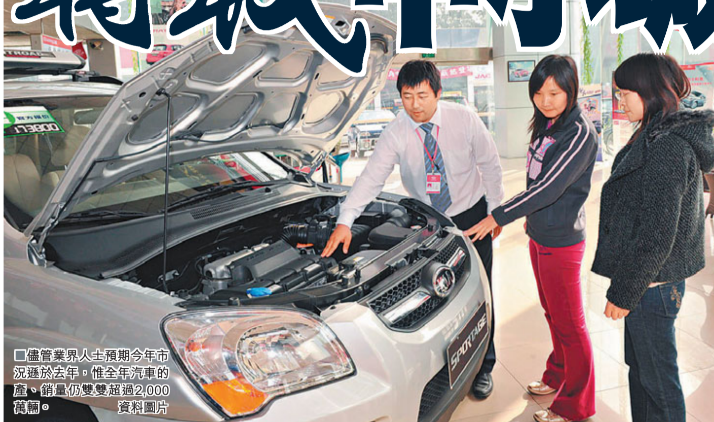
儘管業界人士預期今年市場遜於去年，惟全年汽車的產、銷量仍雙雙超過2,000萬輛。資料圖片