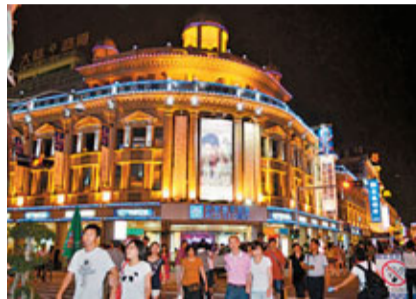
中山路在老市區，是最繁華的街道，是「中華十大街」之一。