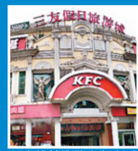
肯德基進駐古色古香的歐陸建築。