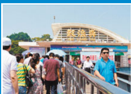
在鼓浪嶼碼頭，遊人如鯽。