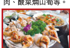
白灼牛肉、梅菜扣肉、酸菜爛山筍等。