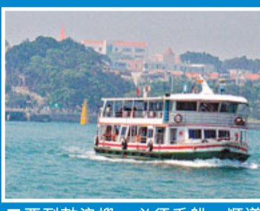
要到鼓浪嶼，必須乘船，順道欣賞周圍風光。