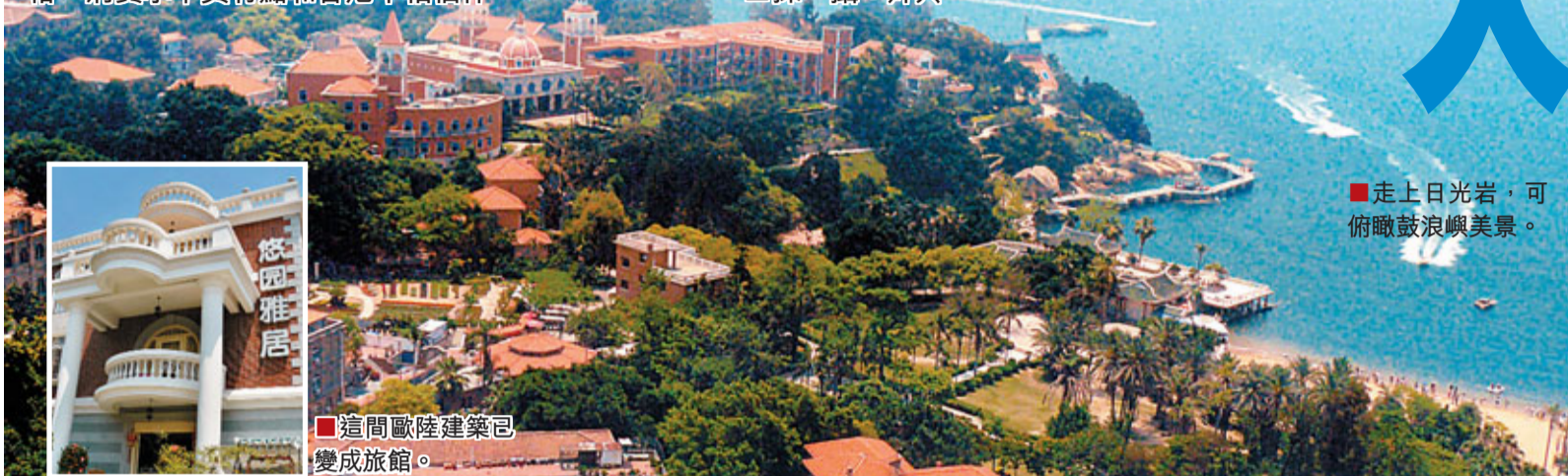
走上日光岩，可俯瞰鼓浪嶼美景。