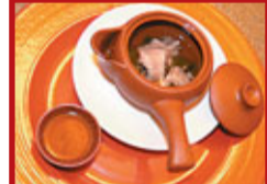
廈門滄州海鮮 龍鳳功夫茶