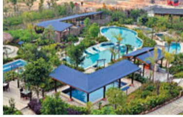
永定下洋客都溫泉酒店