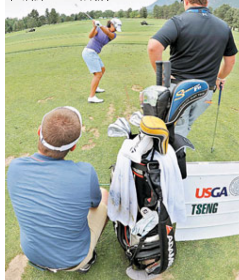
據中央社科羅拉多泉7日電 女子高爾夫美國公開賽，當地時間7日開打的第1天便因雷電暫停，令來自中華台北的世界高爾夫球后