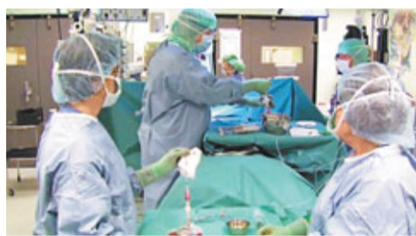
■瑞典醫院進行氣管移植手術。

進行手術的瑞典卡羅林斯卡醫學院表示，接受移植手術的是一名36歲男性患者，其氣管癌已到晚期，儘管已接受化療，但腫瘤仍在增大，幾乎完全堵塞氣管。由於沒有合適的移植氣管，只能利用患者自身幹細胞培育移植所需氣管組織，來進行移植手術。