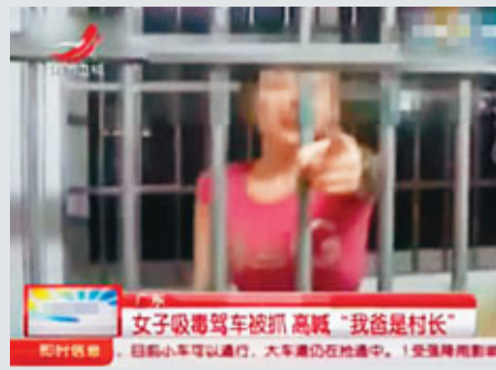
■李某面對警員和記者大叫：「我爸爸是村長」。

他還表示，從目前開始，要從經濟責任審計工作的現實需要和審計隊伍的實際狀況出發，處理好全面和重點的關係，既要全面覆蓋又要突出重點，全面覆蓋就是對各級各類領導幹部都要實施經濟責任審計，突出重點就是要對審計對象實行分類管理，有重點有針對性的開展審計。