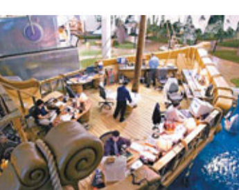
員工在海盜船模型上工作。