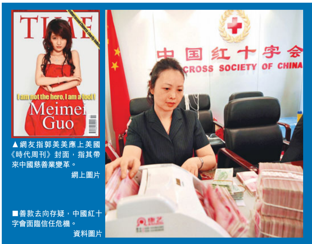
▲網女指郭美美上美國《時代周刊》封面，指其帶來中國慈善業變革。

另據8日在北京發佈的中國基金會發展獨立研究報告稱，截至2011年2月18日，中國已有2094家基金會，公募基金會(可向公眾募捐)1,069家，非公基金會1,025家。基金會數量逐年遞增，與此相反的是，基金會的信息披露仍是難題，僅有不足三成的基金會擁有官方網站，其中只有一半的官網經常更新。