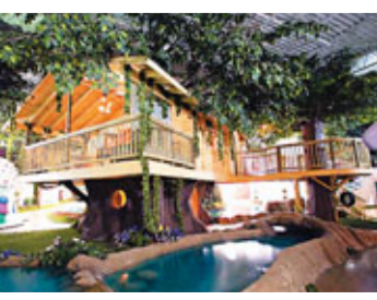
樹屋辦公室被溪水環繞。