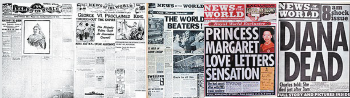
《世界新聞報》版面，(左起)1901年、1936年、1966年、1994年、1997年。

分析指出，小報熱衷出位手段，全因為傳媒的激烈競爭環境。專門研究在小報出位行徑的《衛報》記者戴維斯指出，小報編採是一個被「恐懼」統治的國度，記者擔心如果不能定期炮製獨家猛料，便會「人頭落地」。