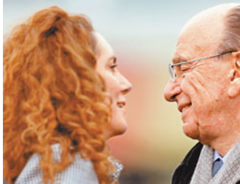
梅鐸(右)視布魯克斯(左)為「契女」。