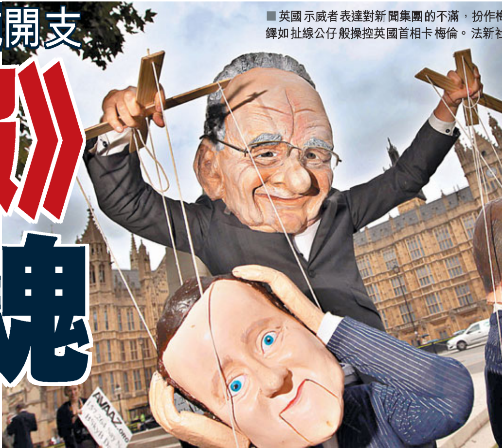
英國示威者表達對新聞集團的不滿，扮作梅鐸如扯線公仔般操控英國首相卡梅倫。

分析說，梅鐸在「留一線」聲當中，仍然力挺布魯克斯，顯示他態度強硬，認為集團是「神聖不可侵犯」。梅鐸現時控制1/3英國報章市場，政客一方面不願與梅鐸有來往，但又怕樹敵隨時「中箭」，心情矛盾。國會議員是否因醜聞對新聞集團一沉百跌，還是「留一線」，還是未知之數。 ■《每日郵報》