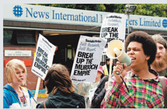
倫敦示威者在新聞集團總部抗議竊聽事件。

種種原因造成英國小報坐大，全球傳媒都「自嘆不如」。法國有嚴格的隱私法，曾在專門報道名人資訊的《巴黎競賽畫報》任職，現時在《巴黎人報》工作的記者格舍爾更稱，從未聽過法國傳媒運用截聽、聘私家偵探等方式。在德國，10多年前政治人物施羅德(後