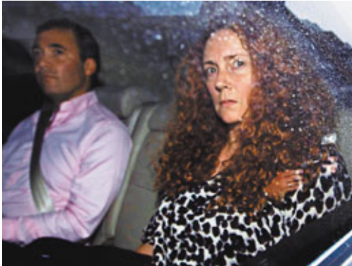
布魯克斯昨日離開報館時，神色低沉。