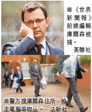
警方搜庫爾森住所，檢走電腦等物品。

同屬小報的英國《太陽報》一向只在周一至周六出版，但傳媒發現「TheSunOnSunday.co.uk」、「TheSunOnSunday.com」和「SunOnSunday.co.uk」等3個網名都在本月5日被某人神秘註冊，使外界揣測《世界新聞報》將會「變身」成《星期日太陽報》。