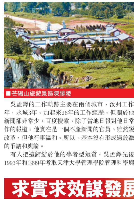
■芒山旅遊景區陳勝橋