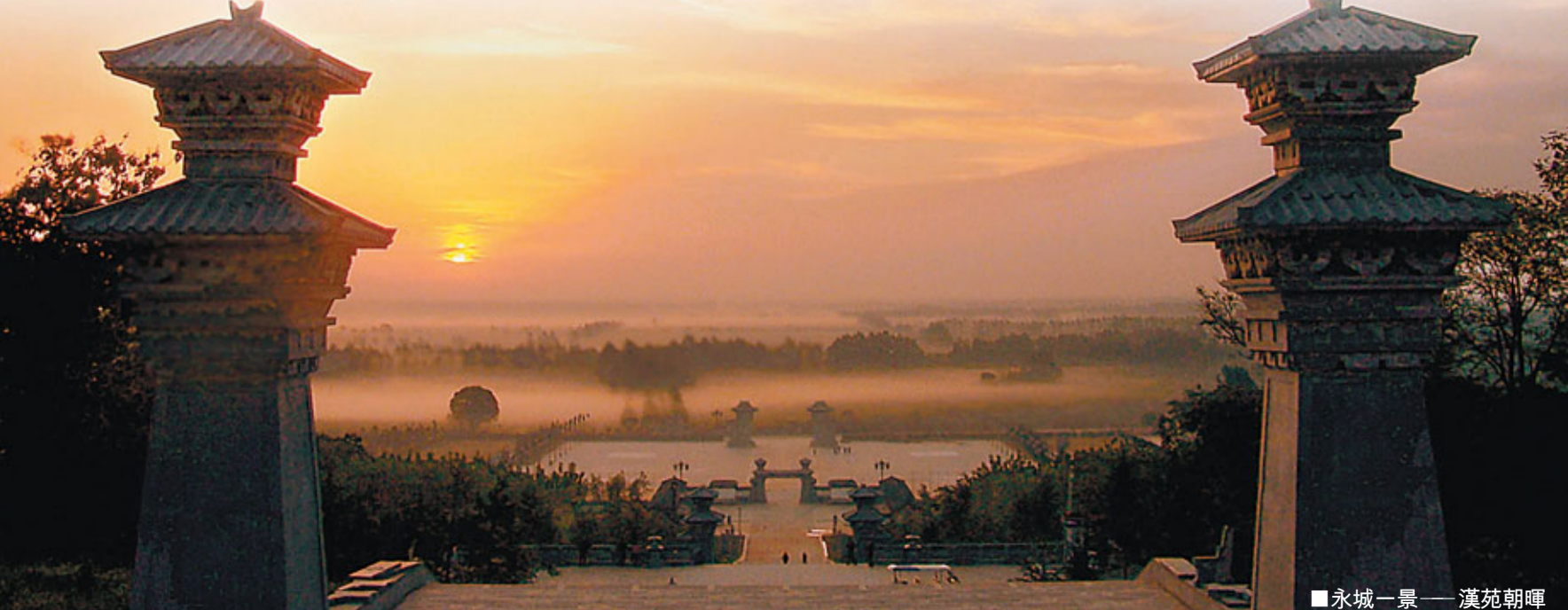
■永城一景——漢苑朝碑

不做事，做實事，是他的理念。他的名言是，「不在理論上講那麼多，關鍵在實踐上下工夫。」 在永城四城聯創期間，城市綠化他首先從小街小巷做起，因為那才是老百姓的生活聚集區。他摒棄那些主幹道美輪美奐，而小街巷污水橫流的做法。 他話中從來沒有「做官」、「當官」、「官員」等字眼。別人說「清清白白做官」，他說「清清白白從政」。