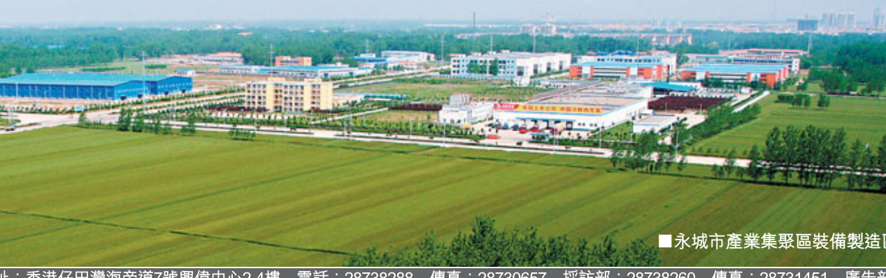
■永城市產業集聚區裝備製造區