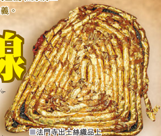
■法門寺出土絲織品上纏繡的纏金線。