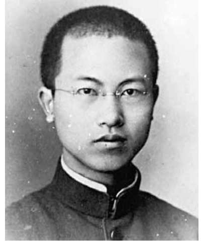
■中共早期領導人施存統。網上圖片