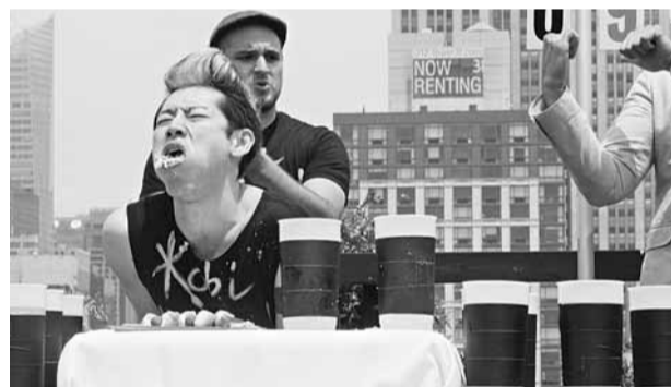
日本大胃王小林尊沒參加今次大賽，但同在當地一個天台上的節目表演狂食熱狗。他結果吃了69隻後，擺出「作嘔」狀。