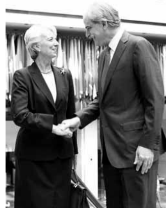
拉加德(左)在IMF總部與代理總裁利普斯握手。

前法國財長拉加德昨日正式接掌國際貨幣基金組織(IMF)，成為該組織歷史上第11位總裁，也是IMF自1944年成立以來首位女總裁，年薪46.8萬美元(約364萬港元)，超過前總裁卡恩和美國總統奧巴馬。