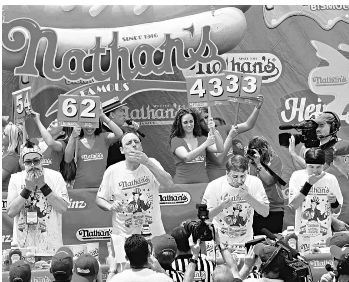
5冠王切斯特納特(左二)將熱狗塞入口，但表情未見太痛苦。美聯社