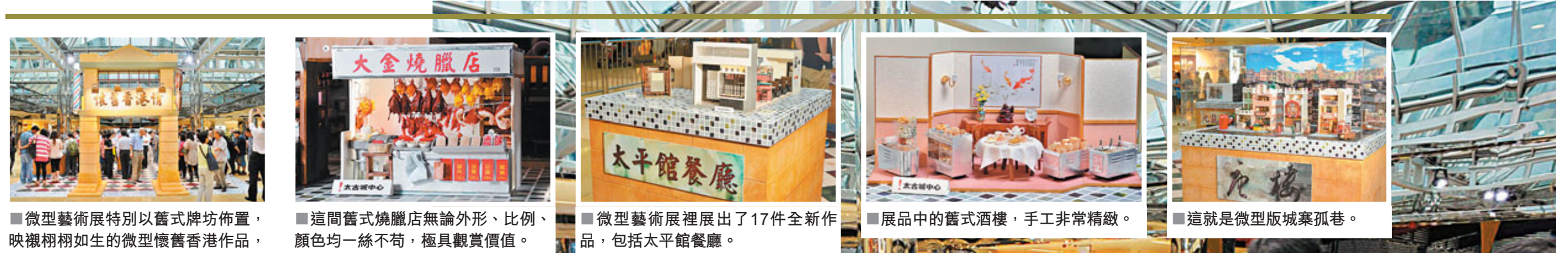
■ 微型藝術展特別以舊式牌坊佈置，映襯栩栩如生的微型懷舊香港作品，讓人猶如置身舊香港老街。