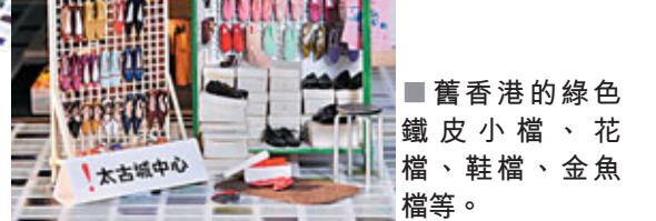
■ 舊香港的綠色鐵皮小檔、花檔、鞋檔、金魚檔等。

在家裡，這樣就可以留住這些美食，可以時常看到，她家裡現在能放置的空間都擺滿了自己的作品。