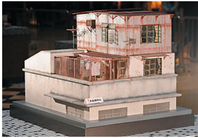
■ 展品中包括天台屋及Q版唐樓等，反映舊香港的住屋生活。