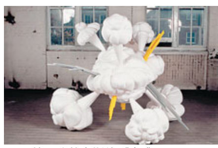
■ 馬特·法蘭克斯的《轟!!》。

過去三十年間，英國當代藝術在英國社會擔當了更多的社會責任，這變化在某程度上促進了「YBAs」的產生。同時，1984年特納獎的設立、2000年泰特現