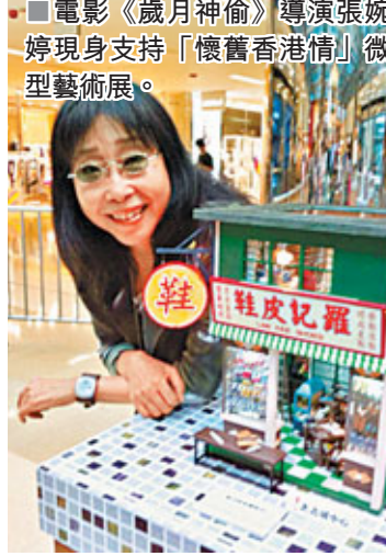
■ 電影《歲月神偷》導演張婉婷現身支持「懷舊香港情」微型藝術展。