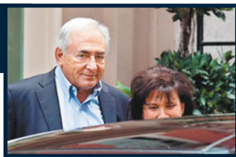
工揭揭謊連篇，卡恩脫罪在望，傳媒和警方猶如被擱一巴掌。有分析指出，法國一直不乏反美情緒，事件使法國對美國怒火重燃。 ■路透社/美聯社/《紐約時報》/《每日郵報》

知卡恩身份顯赫，為他口交後希望大賺一筆，豈料他拒付肉金，令女工惱羞成怒，遂報稱遭強姦。女工提告後，由檢察官安置在酒店期間，有消息揭她繼續接客，多名男訪客現身，富商、小販及的士司機也是其客人。此外，美國傳媒對卡恩「未審先判」，警方又為他扣上手銬示眾，連串事件令法國反美情緒高漲，法民認為美國不僅侮辱卡恩，更羞辱法國。美媒一度將卡恩當成已被定罪，豈料女