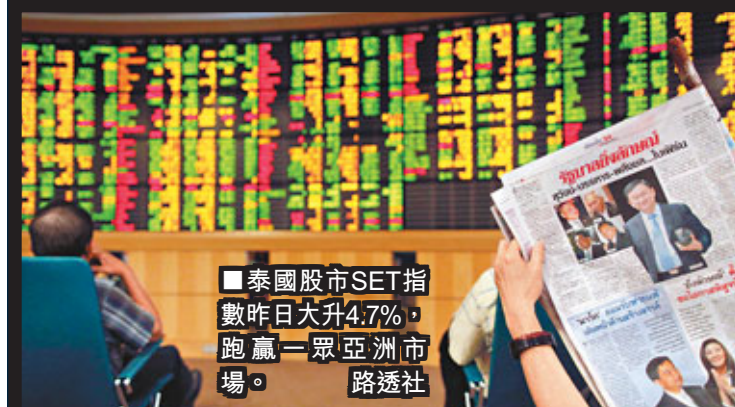
■泰國股市SET指數昨日大升4.7%，跑贏一眾亞洲市場。