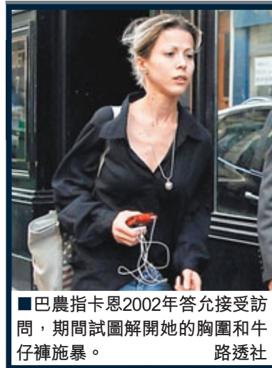
■巴農指卡恩2002年答允接受訪問，期間試圖解開她的胸圍和牛仔褲施暴。

法國女作家巴農早前公開聲稱於2002年遭國際貨幣基金組織(IMF)前總裁卡恩企圖強姦，其代表律師昨日表示，巴農將於今日入稟控告他企圖強姦，意味他可能要面對另一場官司，令他能否回國競逐法國總統成疑。在被控企圖強姦紐約酒店女工一案中，卡恩因原告誠信受質疑而甩身，令他代表法國社會黨競逐總統的希望重燃。巴農表示，卡恩在2002年答允接受她訪問，