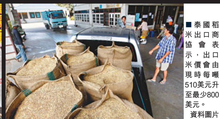
■泰國稻米出口商協會表示，出口米價會由現時每噸510美元升至最少800美元。

政 治陰霾消除，刺激泰銖昨日中段升1.1%，兌美元升至30.48，是自2008年2月以來最大升幅；泰國股市SET指數昨收報1,090點，升4.7%，升幅是自去年4月以來最大。然而，香港等地可能因為泰黨大勝而要捱貴米。為泰黨競選時承諾一旦上台便會推行價格干預政策，以高於市價66%的價格，即最少以每噸1.5萬泰銖，向農民收購稻米，遠高於目前9,000泰銖的收購價。泰國稻米出口商協會表示，出口米價會由現時每噸510美元升至最少800美元，警告該國稻米未來數月出口價格或急升最少50%，隨時動搖全球最大稻米出口國地位。