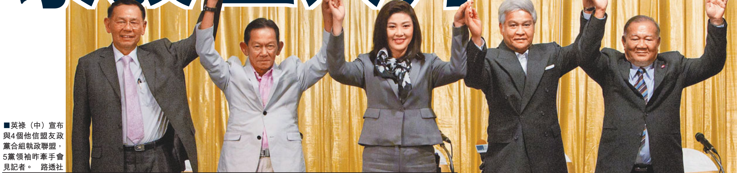
■英祿(中)宣布與4個他信盟友政黨合組執政聯盟，5黨領袖昨牽手會見記者。

泰國大選塵埃落定，由前總理他信妹妹英祿領導的為泰黨大勝，奪得國會過半數議席，將成為泰國首位女總理的英祿昨宣布與4個他信盟友政黨合組執政聯盟。外界關注軍方會否承認選舉結果，擔心會重演2006年軍事政變。即將卸任的國防部長巴維大派「定心丸」，表明軍方不會插手。外國投資者展望該黨能帶來政局穩定，帶動泰國股匯大升。