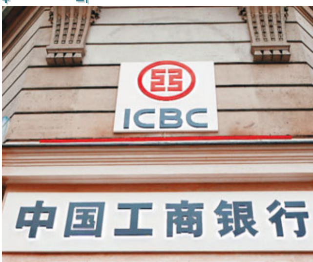
■以市值計,工商銀行以2,511億美元位列第四,排名為中資銀行最高。

香港文匯報訊(記者 李理 北京報道)英國《金融時報》最新全球500強上市企業榜單在此間新鮮出爐。排名結果顯示,埃克森美孚石油和中石油繼續佔據以市值計算的全球第一和第二大公司寶座。在全球500強上市企業中,合計53家中國企業入圍。