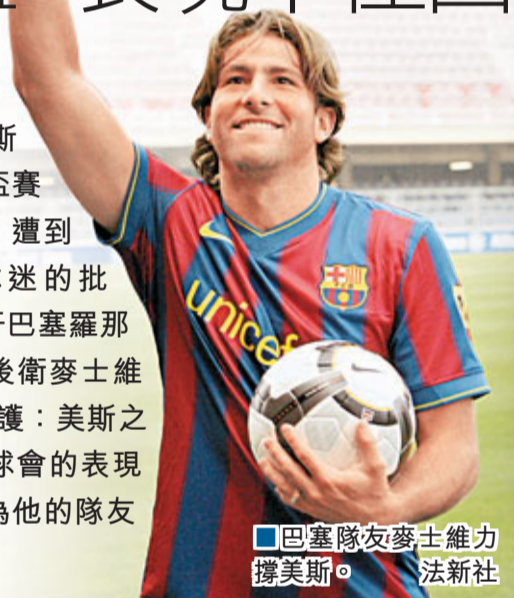
■巴西隊友麥士維力挺美斯。

阿根廷球星美斯，在國家隊的美洲盃賽首秀上表現平平，遭到阿根廷媒體和球迷的批評。美斯在西班牙巴塞羅那的隊友、巴西隊後衛麥士維則在2日為美斯辯護：美斯之所以在國家隊和球會的表现截然不同，是因為他的隊友不同。