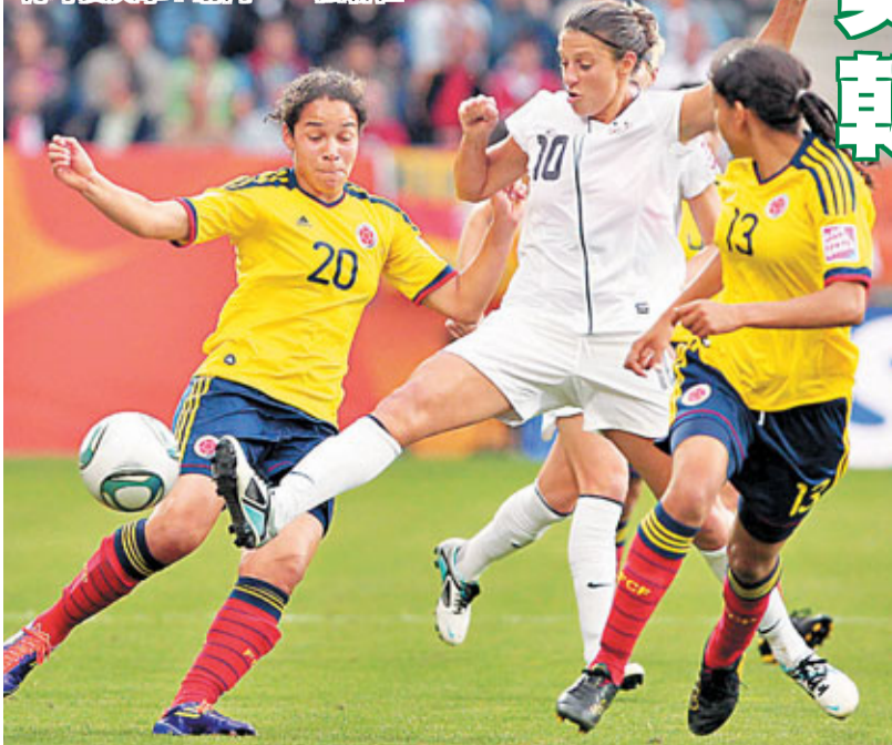
■美國隊妮洛特(中)在兩名哥隊球員夾擊下射門。