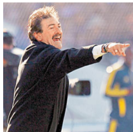
■哥隊的阿根廷教練列卡多批評阿根廷球星不重視國家隊。美聯社

哥倫比亞隊以3分的積分暫列A組首位，阿根廷隊和玻利維亞隊同積1分，並列第二，哥斯達黎加隊則積分墊底。 ■新華社