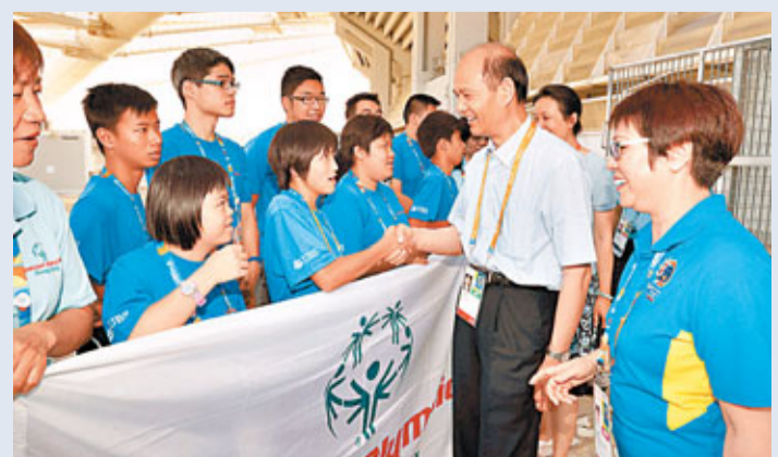
■中國駐希臘大使羅林泉到田徑場為港隊打氣。

香港文匯報訊 香港特奧代表隊於7月2日在特奧賽事中再奪13金。香港保齡球隊已完成特奧世界賽，共奪2金5銀3銅，其中一面金牌是來自男子隊決賽；足球隊在足球7人賽中，以三勝一和姿態奪金；韻律體操隊可說是大豐收，首次參賽，周結雯(9歲)個人獲得2銀3銅的成績，而隊友14歲的羅嘉儀更是橫掃5金(其中一面是個人全能金牌)；游泳隊繼續報捷，於2日連奪五金，包括陳浩恩得男子100米蛙及男子200米背；張浩倫奪女子200米背泳；王曉瑩及殷嘉敏分別於女子F02及F01組別得100米蛙金牌。