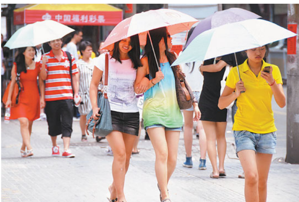
■從地域分布來看，高溫線將貫穿南北。圖為7月3日，福州驕陽似火，最高氣溫達到37.8°C，行人要撐遮陽傘出行。

氣象專家表示，隨著夏天的到來，以後高溫將成常態。專家提醒，當紫外線達到3~4級時，外出時除戴上太陽帽外還需備太陽鏡，並在身上塗防曬霜；當紫外線指數達到5~6級時，外出時必須在陰涼處行走。此外，考慮到前期空氣濕度比較大，所以大家外出感覺會很悶熱，請務必做好防暑降溫措施，盡量避免午後高溫時段的戶外活動；老人、小孩以及體質較弱的人群需採取必要的防護措施，注意休息時間，保證睡眠，必要時準備一些常用的防暑降溫藥品。