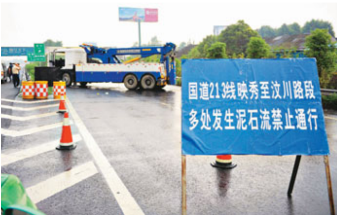
■汶川「生命線」213國道在泥石流衝擊下，再度中斷。

香港文匯報訊(記者 唐鑾宇 成都報道)受局部強降雨影響，四川汶川縣境內3日發生多處泥石流、山體垮塌，導致連接成都與汶川的「生命線」——213國道再度中斷。受此影響，都汶高速公路也於3日上午9點30分關閉。另外，四川省阿壩州茂縣南新鎮棉簇村境內，昨發生泥石流災害，該村鑫鹽化工有限公司、西輝硅業、天和硅業廠區和20餘農戶房屋被泥石流沖毀，泥石流同時還造成了泥鑫鹽化工有限公司有毒氣體洩漏。