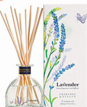
■售價：HK$495 / 200ml