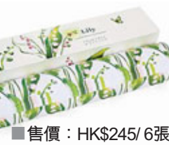
■售價：HK$245 / 6張