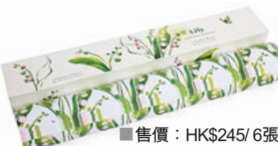
■售價：HK$245 / 6張