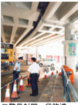
■警員封閉一段路邊。

香港文匯報訊（記者 杜法祖）以「打小人」聞名的灣仔堅拿道天橋底，昨晨發生石屎剝落意外。天橋底一幅石屎剝落，但未有擊中途中人。警方到場，恐防橋底石屎有繼續剝落危險，一度封路。直至路政署人員到場，把有危險的石屎剝除，現場始獲解封。