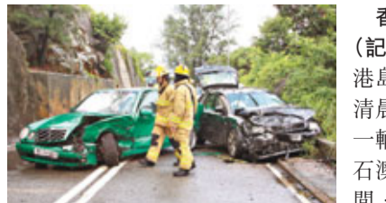
■石澳道平治與奧迪迎頭相撞現場。

香港文匯報訊（記者 杜法祖）港島石澳道昨日清晨發生車禍。一輛平治房車沿石澳道入石澳期間，疑因天雨路滑，在近石礦場一個彎位切線時失控，與迎面一輛私家車相撞。2車車頭嚴重毀爛，平治司機受傷。私家車上3名外籍男女則安然無恙。警方正調查肇事原因。受車禍影響，石澳道來往交通一度癱瘓。