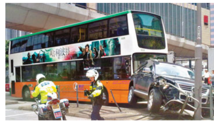
■切線私家車被新巴撞至闖上路中的意外現場。

事發昨午12時16分，自馬鞍山開往中環的680線新巴，經東隧抵港島後，沿東區走廊西行，途至通往北角支路斜路，越過渣華道駛入民康街時，一輛有中、港兩地車牌的黑車，由慢線切入快線。新巴收掣不及，從後撞向私家車。私家車被撞至失控剎上右邊分隔行車線石壘，撞毀一段約5米鐵欄，繼而夾在電燈柱與新巴車頭間。