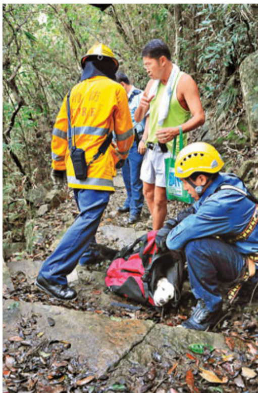
布力徑墮坡曲架犬獲救後疑中暑虛弱。狗主其後抱狗急跑15分鐘出路口，交愛護動物協會救車接走治療。

另外，一頭飼養在漁船上的唐狗，昨晨9時許，被人發現在筲箕灣避風塘近嘉亨灣對開墮海。水警及消防船接報到場搜救，但唐狗已輾轉遭沖走；先被沖出塘口，再被沖到西灣河水警基地後自行爬上橋邊。消防員與愛護動物協會人員聞訊趕抵時，狗主經已駕小艇到場，把唐狗救走，事件僅屬虛驚一場。