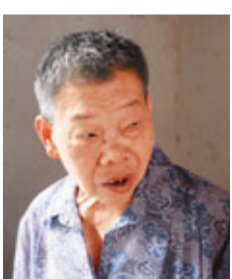
▲村民黃婆婆擔心遷出前安全受威脅。