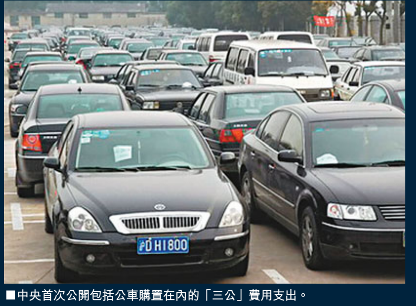
■中央首次公開包括公車購置在內的「三公」費用支出。

決算報告還指出,2010年中央公共財政收入42,488.47億元,完成預算的111.6%,比2009年增長18.3%。中央公共財政支出48,330.82億元,完成預算的103.6%,增長10.3%。其中,2010年中央財政用在與人民群眾生活直接相關的教育、醫療衛生、社會保障和就業、保障性住房、文化方面的支出合計8,920.59億元,增長20.2%。此外,2010年中央財政用於「三農」的支出合計8,579.7億元,增長18.3%。