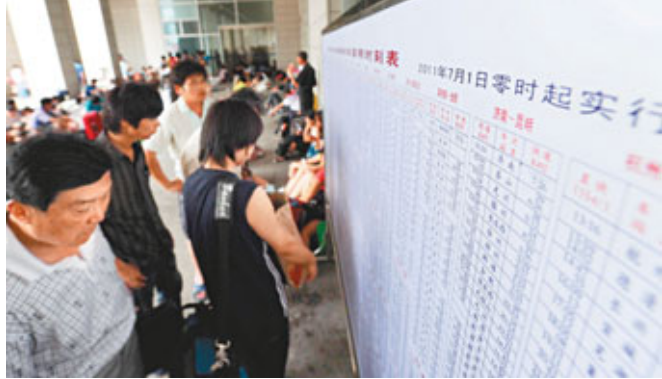
■7月1日起,全國鐵路將實行新的列車運行圖。

香港文匯報訊(記者 唐苗苗、通訊員 蘇艷 廣州報導)昨日(7月1日)是全國調圖首日,也是暑運第1天,廣鐵共發送旅客59.5萬人次,較前一天增加2.1萬人次,比去年同期增長20%。預計9日起出現學生客流高峰。另悉,1日起廣深線也調整列車運行圖。