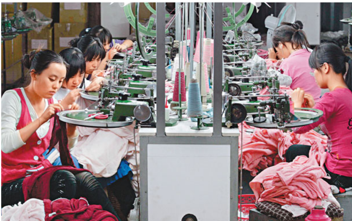
■6月內地製造業採購經理指數(PMI)回落至50.9%,較5月時的52%再降1.1個百分點,創28個月以來最低。圖為山西某工廠車間一隅。

國務院發展研究中心研究員張立群認為,6月份PMI指數繼續回調,表明基於通脹預期改變的庫存調整已經開始,預示未來經濟增長率可能繼續降低。但他同時指出,由於庫存調整是短期現象,預計引起的經濟下行不會很深,也不會持續很久。