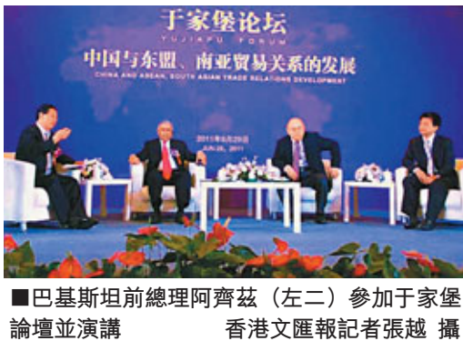
■巴基斯坦前總理阿齊茲(左二)參加于家堡論壇並演講

自2010年11月于家堡論壇首次舉辦以來,已經接待了來自國內外多位政要專家,英國前首相白高敦、美國前貿易代表巴爾舍夫斯基、英國前首席國務大臣曼德爾森、林肯藝術中心總裁雷納德、萊維、中國入世首席談判代表龍永圖等紛紛參加到這一交流平臺。