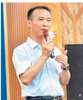
費俊龍認為考試只是一種手段，勉勵學生不應害怕考驗。

香港文匯報訊（記者 周婷）航天工作雖然繁重，但神六兩位航天員費俊龍、聶海勝及神七的劉伯明在完成日常訓練後，亦抽空與來訪的大學生見面，齊齊參與「太空Party」，期間更落力參與遊戲，表現親民，令同學印象難忘。