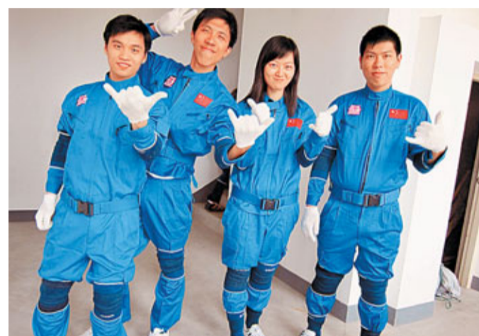
進行「跳逃逸塔」體驗前，大學生須戴上手套、護膝等，以防受傷。

港理大將於7月11日舉辦大學生航天體驗之旅「結業典禮」，屆時各參加學生需分組進行口頭報告，總結旅程所得及感受。