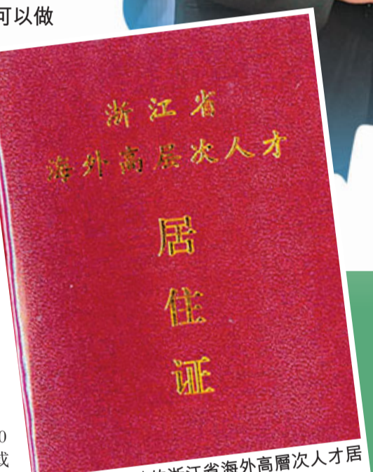
■俗稱「紅卡」的浙江省海外高層次人才居住證。