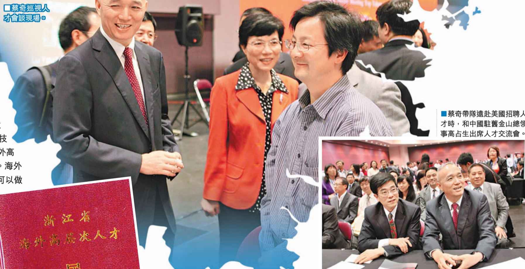
■蔡奇帶隊赴美國招聘人才時，和中國駐舊金山總領事高占生出席人才交流會。