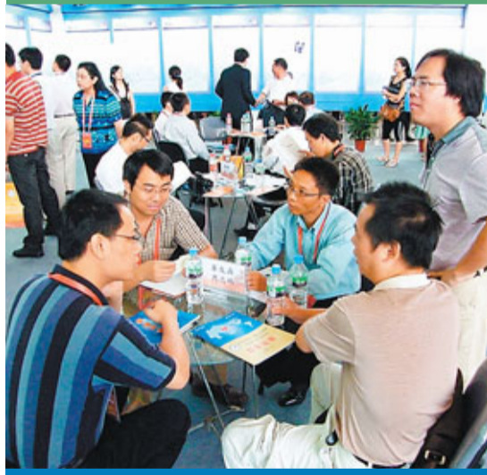
■海外留學人才在「寧波人才科技周」上，與企業洽談合作。

招才若渴的浙江，在蔡奇的推動下已吸引了一大批海外高層次人才，目前浙江入選國家「千人計劃」人數高居全國第四位，並將建立海外引才長效機制，構建吸引海外高層次人才的服務平台。