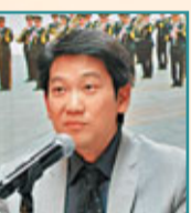
民政事務局常任秘書長楊立門

民政事務局常任秘書長楊立門表示，當局很高興能邀請到解放軍軍樂團來港演出，讚揚樂團是國家獨一無二的禮儀樂團和大型專業管樂表演團體，為逾百個到訪的國家元首和政府首腦演奏，更為歷次國慶慶典、香港和澳門回歸交接儀式，以及北京奧運會、上海世博會等重大活動的司禮演奏。楊立門又指，香港警察樂隊經常與市民接觸，今年適逢香港警察樂隊成立60周年，他們與軍樂團同台演出，互相交流，特別有意義。