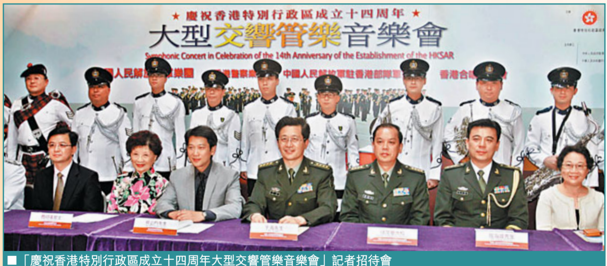
「慶祝香港特別行政區成立十四周年大型交響管樂音樂會」記者招待會

為熱烈慶祝香港回歸14周年，由中國人民解放軍軍樂團、香港警察樂隊、駐香港部隊軍樂隊和香港合唱團協會首次聯合演出的大型交響管樂音樂會——「慶祝香港特別行政區成立十四周年大型交響管樂音樂會」，由香港特別行政區政府主辦，民政事務局承辦，康樂及文化事務署統籌，今次合唱協會有百多位團員參與；再加上駐香港部隊軍樂隊，軍、警、民同台演出，超過400人的陣容，以美妙樂韻結合儀仗表演及影片，與港人一起回顧香港歷史發展及繁榮景象，實在難得一見。