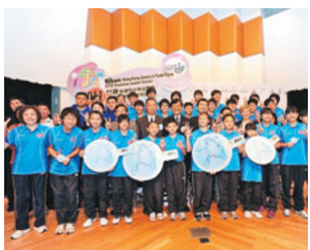
一眾嘉賓、贊助商與香港青少年隊教練及球員來一張大合照。伯體育館派發，每人每節最多可索取4張門票，先到先得，派完即止。