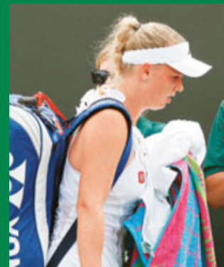
禾絲妮雅琪提早執包袂。