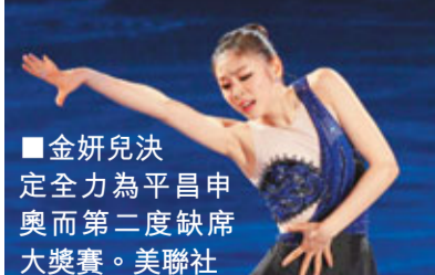
金妍兒決定全力為平昌申奧而二度缺席大獎賽。

國際滑聯公布參加本季大獎賽的運動員名單，金妍兒不在其中。花滑大獎賽每季由6個分站賽和總決賽組成，受邀參加的選手可選擇其中的2站比賽，最終得分最高的6位選手獲得參加年終總決賽的資格。金妍兒奪得2010年溫哥華冬奧會和當年世界錦標賽的雙料冠軍，不過她並沒有參加2010年大獎賽，本年度是她第二次缺席該賽事。