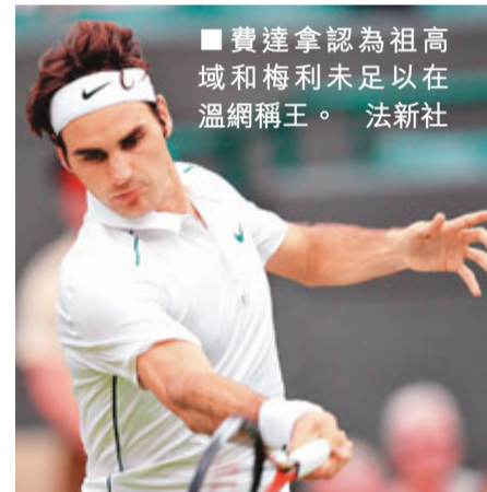
費達拿認為祖高域和梅利不足以在溫網稱王。