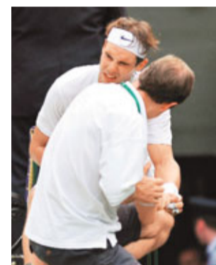
拿度左腳受傷，無比痛楚。