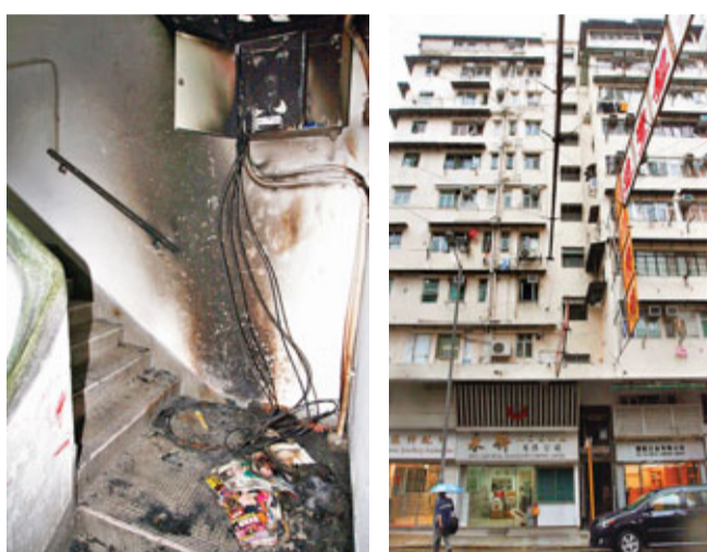
唐樓梯間寬頻電箱遭縱火焚毀，牆壁被熏黑。

今年2月16日，一名男子不滿在酒吧拳手的女友提出分手，竟夥同多名死黨火攻女友在上址9樓居住的「劏房」，逼女友開門後將其打傷，唯一可上天台的前梯，亦因舊建物而無法通行……一家5口在現場唐樓4樓自置物業，居住已10多年的馮先生昨日向記者無奈表示，所住唐樓危機重重，發生火警時都不知如何是好，盼當局正視問題。