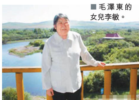
■毛澤東的女兒李敏。

在這些被人們親切稱為「紅色後代」的身上，記者絲毫未見霸氣、官氣和矯揉造作，這種親民作風令人深深感動。事實上，他們的特殊身世令他們承載了數倍於常人的責任和義務。時至今日，事實可以證明，他們不僅已經承擔起歷史賦予的特殊使命，還進一步將其發揚光大。而他們身上所體現的低調隨和、謙遜待人，其實也正暗合了今日的中國在國際上所彰顯的低調務實與平穩崛起的姿態。