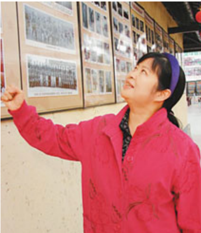
■毛小青希望年輕一代不要忘記歷史。