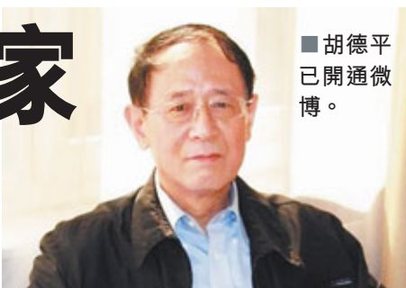
■胡德平已開通微博。

採訪臨近結束，陳昊蘇仍感慨不已，還特意為慶祝中共建黨90周年賦詩一首：「一輪旭日出東方，萬里山河盡曙光，九十春秋頌創業，長征歲月永輝煌。紅軍後代豪情灑，赤縣前程大運昌，革命真情唯進步，英雄黨史續華章。」