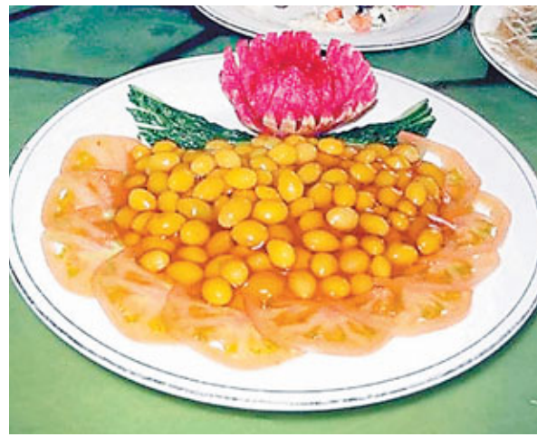
「詩禮銀杏」是孔府宴會用的名菜之一。