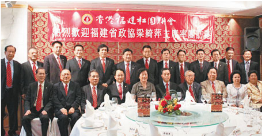
福建社團聯會宴請福建政協主席梁綺萍一行,賓主合影留念。

梁綺萍則以「人心齊、事業旺、力量大」來形容福建社團聯會,讚揚閩籍鄉親重任在肩,為香港落實「一國兩制」、政治穩定、經濟發展一路貢獻心力。她提及福建省政協不斷致力於完善對委員的服務與管理,得到港區委員的支持和配合,希望今後借聯誼會平台實現更多兩地合作互動。她又勉勵委員們要履行好政協委員應