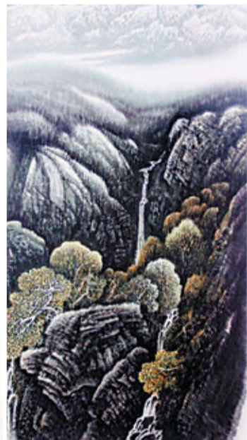
雖居焉支山 不道逆雪寒