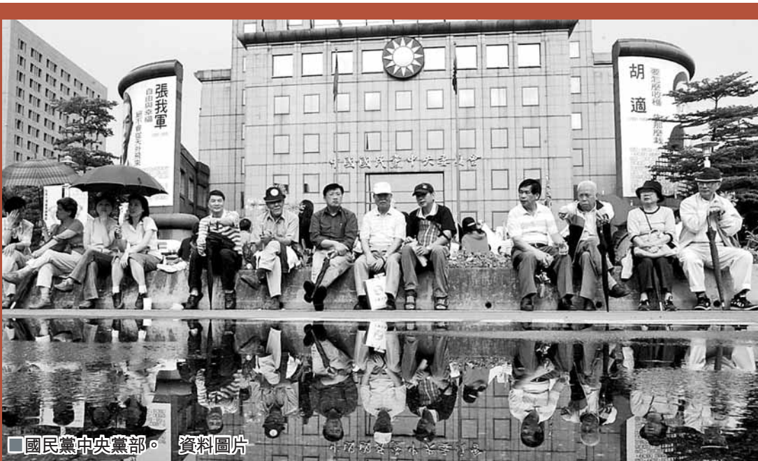
國民黨中央黨部。 資料圖片

此外，下一任政府對政策的執行力及危機處理能力亦受到68%受訪者的關注，僅次於兩岸關係；其他備受關注的議題還包括政府負債(61%)、貧富不均(60%)、藍綠對立(58%)及解決經濟與環保的對立(53%)。