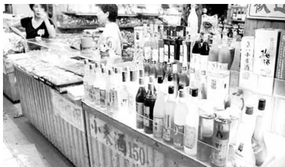
■島內傳出市面部分小米酒釀酒原料是以糯米及白米混充。

據中通社27日電 小米酒是台灣少數民族特釀的酒，不少風景區將之當成「台灣特色禮品」推銷給大陸及海外遊客，但27日有島內媒體揭發，市面近九成的小米酒，多非小米釀製，甚至部分只是澱粉加酒精的「化學雞尾酒」。有釀酒師指出，台灣的小米產量不多，加上真正的小米酒需經多道工序釀製，「一瓶少說也要150元(新台幣，下同)以上，低於100元的不用喝也知道是假的。」