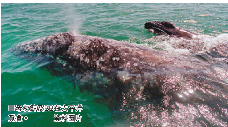
母灰鯨及BB在太平洋覓食。