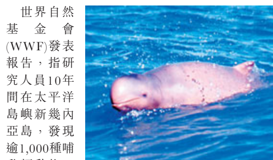
世界自然基金會(WWF)發表報告，指研究人員10年間在太平洋島嶼新幾內亞島，發現逾1,000種哺乳動物、雀鳥、魚類等新物種，當中包括稀有的淡水鯊魚、粉紅色的扁鰭海魚(見圖)等，令人鼓舞。

WWF報告顯示，於1998至2008年的10年間，研究團隊在新幾內亞島森林、河流及濕地，發現1,060多種新物種，即每周發現2種。其中一種淡水河流鯊魚由於非常稀有，經發現後立即列入瀕臨絕種名單；一種扁鰭海魚，更是逾30年來首次發現的新海魚物種。