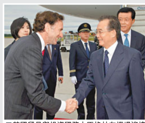
英國貿易與投資國務大臣格林在機場迎接溫家寶。

香港文匯報訊 據《人民日報》報道，中國總理溫家寶25日在匈牙利首都布達佩斯出席中國—中東歐國家經貿論壇時表示，中國是歐洲金融市場負責任的長期投資者，中國支持中東歐國家採取的一系列經濟金融調整措施，並對未來中東歐國家金融市場抱有信心。