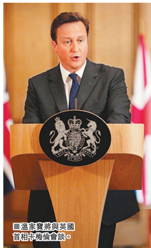
溫家寶將與英國首相卡梅倫會談。

香港文匯報訊 綜合通訊社報道，中國總理溫家寶目前已抵達伯明翰，展開訪英之行。今次是溫家寶繼2009年後再次訪問英國，預計停留時間不足48小時，先後到訪伯明翰和倫敦兩個城市。訪問期間，溫家寶將與英國首相卡梅倫會談，實地考察、參觀一些中英合作項目，並將在英國皇家學會發表演講。在離開英國後，溫家寶會到此行最後一站德國訪問。