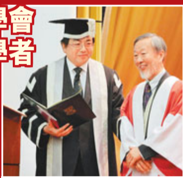
「光纖之父」高錕(右)和港大校長徐立之。