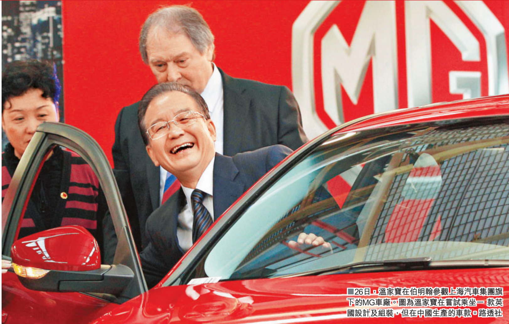
26日，溫家寶在伯明翰參觀上海汽車集團旗下的MG車廠。圖為溫家寶在嘗試乘坐一款英國設計及組裝，但在中國生產的車款。