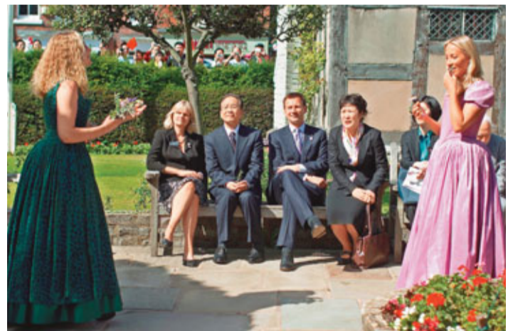
報道指溫家寶非常喜歡莎士比亞的戲劇作品，因此除了參觀其故居外，更欣賞了一個比較簡短的戲劇表演。

對於溫家寶的此次英國和歐洲之行，英國媒體相當關注，英國《每日電訊報》25日還刊發題為《中國龍拯救歐元》的文章，稱中國此時出手將讓歐元區鬆一口氣，而包括英國在內的歐洲國家期待中國的投資。之前在訪問匈牙利時，溫家寶承諾中國是歐元區主權債的長期投資者，並將購買一定數量的匈牙利國債。