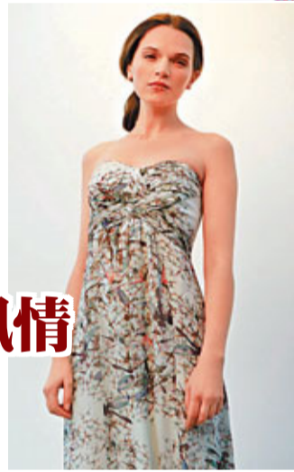
■ TED BAKER服飾，充滿異國風情。

除了碎花圖案外，簡單的圖案連身裙也是今個夏日流行的款式，如束腰設計的印花雪紡吊帶長裙，混上金色線，飄逸性感表露無遺。而且，以黑色為主，配上極具藝術色彩的圖案，簡單的裙款頓時變得不平凡。由深淺不同的顏色組成像油畫一樣的圖案，適合一眾追上潮流又不愛浮誇的OL，為沉悶的辦公室加一點色彩。