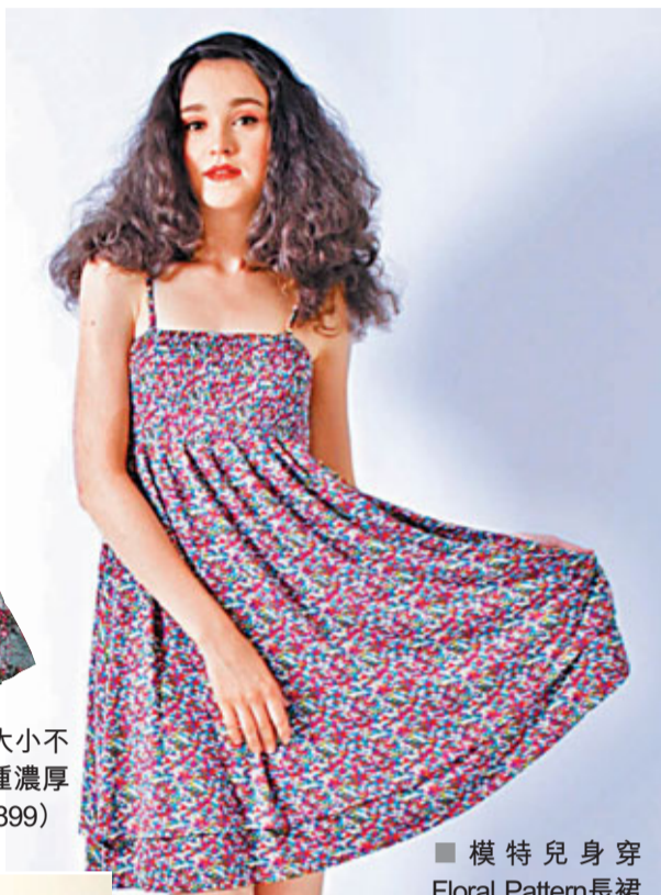
■ 模特兒身穿Floral Pattern長裙 (售價：HK$899)

除了碎花圖案外，簡單的圖案連身裙也是今個夏日流行的款式，如束腰設計的印花雪紡吊帶長裙，混上金色線，飄逸性感表露無遺。而且，以黑色為主，配上極具藝術色彩的圖案，簡單的裙款頓時變得不平凡。由深淺不同的顏色組成像油畫一樣的圖案，適合一眾追上潮流又不愛浮誇的OL，為沉悶的辦公室加一點色彩。