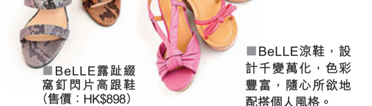
■ BeLLE涼鞋，設計千變萬化，色彩豐富，隨心所欲地配搭個人風格。

同時，BeLLE今季的手袋與鞋履都充滿着浪漫與藝術色彩的意大利風情，加入窩釘、鑲水晶石等，尤其是一雙設計雍容華貴，好像站在舞台上，吸引眾人艷羨目光的高跟鞋。