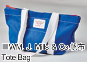
■ WM. J. Mills & Co.帆布Tote Bag