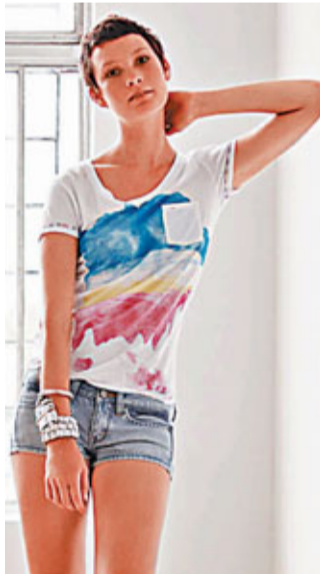
■ 模特兒一身Lee Tropics系列打扮。