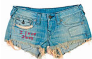
■ 繡有「I love Joey」字樣，配以可愛碎花拼布的Joey Cut Off款式。