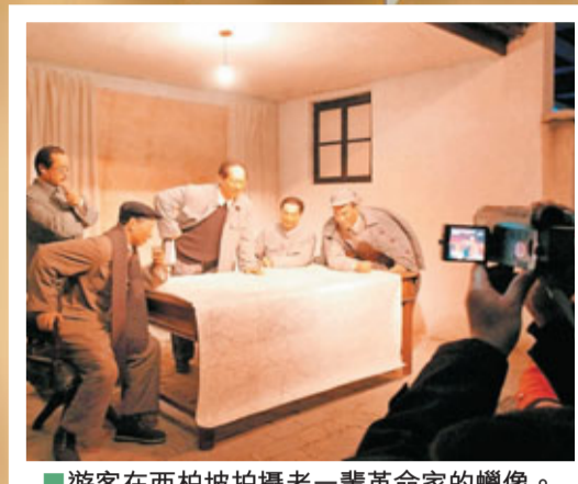
■遊客在西柏坡拍攝老一輩革命家的蠟像。