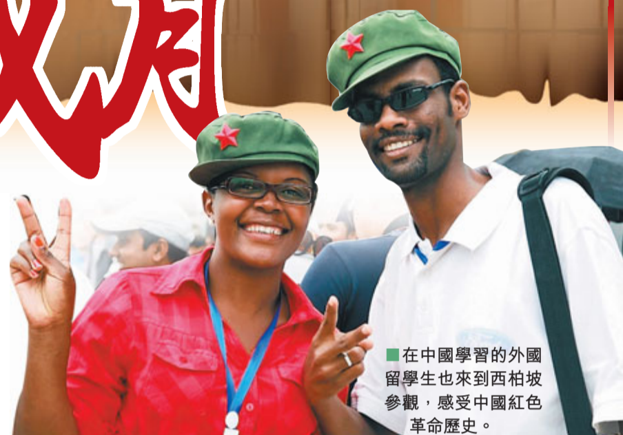
■在中國學習的外國留學生也來到西柏坡參觀，感受中國紅色革命歷史。

河北省旅遊局局長王新勇接受本報記者採訪時表示，河北作為紅色旅遊資源大省，紅色旅遊資源數量多，旅遊資源類型全，地位重要。該省共有133處紅色旅遊資源單體，在全國100個經典紅色旅遊景區中，該省擁有8處14個景區；規劃的全國30條精品線路中，有4條分佈在河北省。