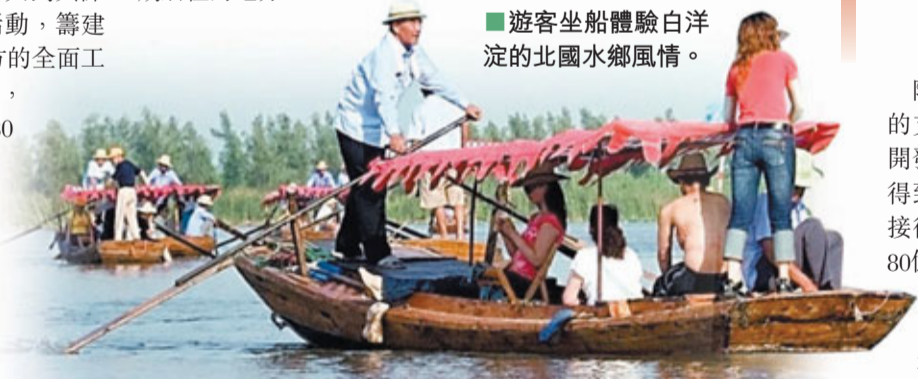
■遊客坐船體驗白洋淀的北國水鄉風情。

樂亭縣大黑坨村是中國共產黨創始人之一李大釗的故鄉，村中有李大釗故居。故居始建於1881年，是一座典型的冀東穿堂院。李大釗故居由其祖父李如珍修建，1889年，李大釗出生於此，是李大釗幼年成長和婚後長期居住的地方。