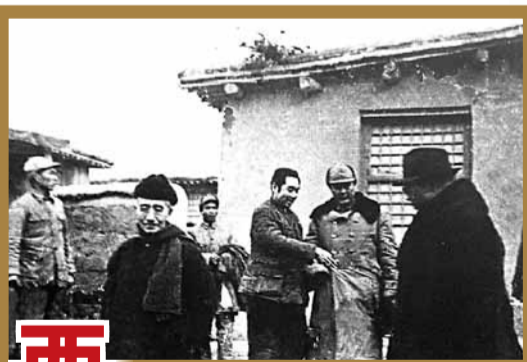
■1949年1月22日周恩來與傅作義在西柏坡宣布和平解放北平（北京）。

館內以時間為順序，採取圖、表、沙盤、雕塑及實物展示等多種形式，從不同角度記錄了抗日戰爭爆發到1945年抗日戰爭勝利期間劉伯承、鄧小平、徐向前等老一輩革命家帶領一二九師將士浴血太行的革命事跡，再現一二九師在太行山區抗戰的輝煌歷史。