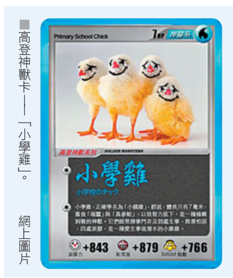
■高登神獸卡——「小學雞」

也有衛道之士指稱此風不可長，粗口茶毒趣味低級之類。事實是當粗口指涉的是市民大眾關心的課題、日常用語、經歷聽聞，只會愈加共鳴不見反感。而且我們對高質素的喜劇戲了很久——所謂處境劇最終都會變成異常冗長情情塔塔千迴百轉，與美國講到明玩愛情、卻更多講人生哲理的爆笑劇《How I Met Your Mother》相去甚遠，也不用題材更闊的《Big Bang Theory》或者《Glee!》。於是港人的笑點被迫愈來愈低，黃子華江郎才盡、詹瑞文繼續他的形體之路，依然教我笑得出來的，竟然是《街坊廚神》金剛的鹹淡廣東話以及爆肚功夫，我們為高登神獸的貼圖與創造力而笑，又有何出奇？