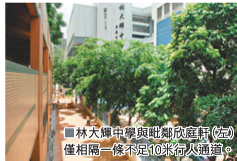
林大輝中學與毗鄰欣庭軒(左)僅相隔一條不足10米行人通道。