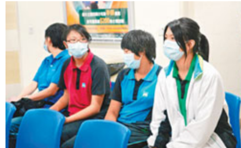
3名被水濺中感不適女生送院檢驗。