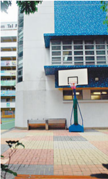
膠水樽被擲落校內操場籃球架附近爆開。