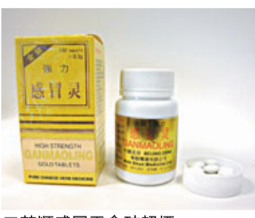
華順感冒靈含神超標。