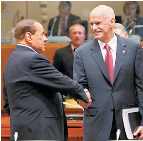
■希臘總理帕潘德里歐(右)出席歐盟會議時，與意大利總理貝盧斯科尼握手，面露喜色。

一連兩日的歐盟峰會傳出好消息，希臘財長與歐盟及國際貨幣基金組織(IMF)代表討論後，就總值280億歐元(約3,102億港元)的緊縮計劃達成協議，為希臘獲得下一輪援助貸款打開綠燈。然而，評級機構穆迪前日警告，可能下調意大利16家銀行及2家政府相關金融機構的評級，拖累意大利主要金融股昨日一度急瀉，其中全國最大的裕信銀行早段跌8%，其後跌幅收窄。