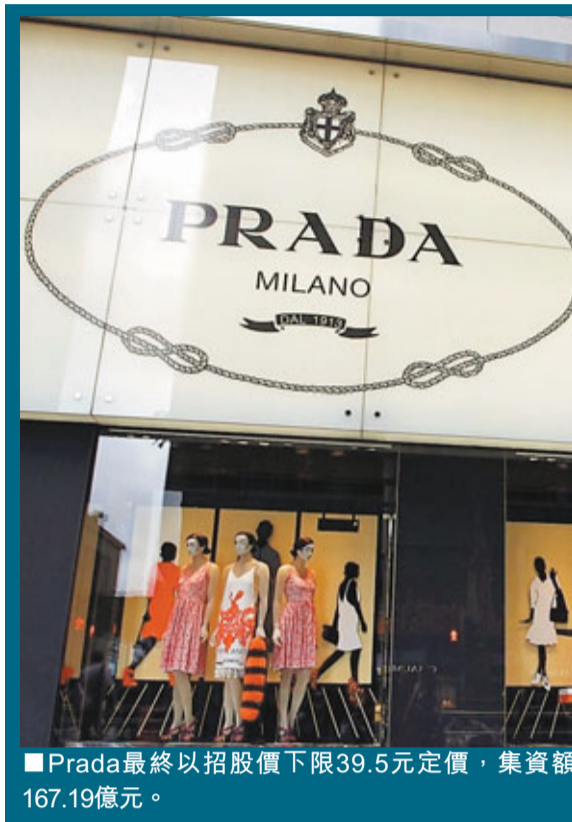
Prada最終以招股價下限39.5元定價,集資額167.19億元。

儘管大市表現不濟,但仍不斷有新股來港上市,然而本港新股市場呈現「有量無質」的狀態。彭博報道指本港成為今年全球IPO股票表現最差的市場之一,