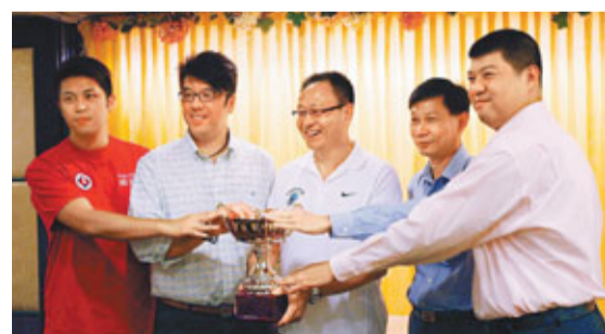
永倫、南華、福建及飛鷹將爭奪金至尊盃錦標。

香港文匯報訊(記者 郭正謙)「金至尊盃超級聯賽」將於7月19日正式展開，本地籃壇四大勁旅南華、永倫、飛鷹及衛冕冠軍福建將聚首競逐冠軍寶座，如去年一樣，參賽球隊均可引入外援加強賽事吸引力，4支球隊均表示已將目標鎖定在NBA級的美國球員身上，保證外援水平一定比往屆更強。