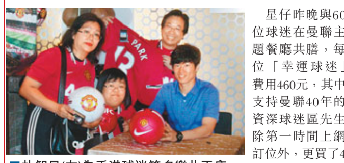
朴智星(右)為香港球迷簽名樂此不疲。

星仔昨晚與60位球迷在曼聯主題餐廳共膳，每位「幸運球迷」費用460元，其中支持曼聯40年的資深球迷區先生除第一時間上網訂位外，更買了4件曼聯球衣找朴智星簽名，區先生認為能與偶像同席，不是金錢可以買到的榮譽。朴智星完成香港站宣傳後，已飛赴上海繼續其宣傳大使之旅。